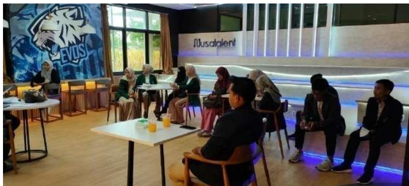
Gambar 1 2 Kegiatan Inkubasi Bisnis Hari Kedua

4.1.2 Kegiatan hari kedua , adalah pemberian materi tentang PITCH DECK. Pitch deck ini adalah sebuah presentasi singkat tetapi detail yang menjelaskan gambaran umum tentang rencana bisnis yang hendak kamu lakukan. Pitch deck iniditujukankepadacalon investor, sehingga penyusunannya pun harus dibuat semenarik mungkin supaya mereka bersedia mendanai bisnismu. Pitch deck iniditidakhanyadigunakan oleh mereka yang akanmengembangkanstartupsaja, tetapi juga UMKM hingga calon karyawan terhadap perusahaannya.