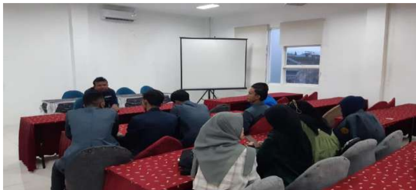
Gambar 1 4 Kegiatan Inkubasi Bisnis Hari Keempat

mahasiswa diharuskan untuk mempresentasikan produk inovatifnya masing - masing, diantaranya sirup belimbin gwuluh, keripik kelapa, keripik pepaya, sambal baby cumi, kerupuk petai, selai nanas, selai nangka, dan teh daun sirsak. Masing - masing produk harus dijelaskan kelebihan dan kekurangannya, untuk mengetahui seberapa bagus setiap produk tersebut, hal itu juga sebagai langkah awal dalam mengevaluasi criteria - kriteria yang perlu diperbaiki.