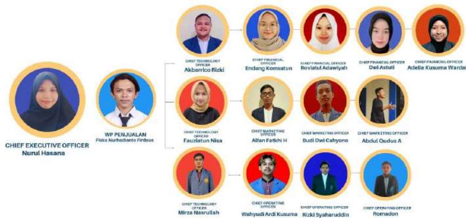
Gambar 1 5 Struktural Anggota

Dalam usaha yang kami rintis ini untuk produksi petai, saya dalam usaha rintisan bertugas menjalankan bagian marketing sebagai Chief Marketing Officer (CMO) pada divisi pengembangan produk, yang secara tidak langsung, berkontribusi pada pertumbuhan usaha rintisan. karena bagian ini juga melakukan relasi dengan pihak lain, hal itu ditujukan untuk mengembangkan dan menumbuhkan usaha rintisan secara lebih baik. Bagian dan devisi ini di tuntut untuk bisa berpikir inovatif dan mengidentifikasi peluang penambahan, penghapusan, atau modifikasi terhadap produk, layanan, dan proses, agar tujuan usaha terlaksana dengan baik.