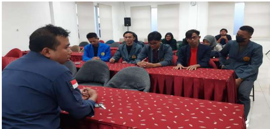
Gambar 1 3 Kegiatan Inkubasi Bisnis Hari Ketiga

BMC (BUSINESS MODEL CANVAS). Business Model Canvas atau yang biasa disingkat BMC adalah sebuah strategi dalam manajemen yang berupa visual chart yang terdiri dari 9 elemen untuk membantu perencanaan bisnis sebelum dibentuk. Kegiatan hari keempat adalah HPP dan BEP. Harga Pokok Penjualan atau HPP adalah jumlah pengeluaran dan beban yang dikeluarkan secara langsung maupun tidak langsung untuk menghasilkan produk atau jasa. Sedangkan menurut prinsip akuntansi Indonesia, harga pokok penjualan dapat dijelaskan sebagai jumlah pengeluaran dan beban yang diperkenankan, baik secara langsung maupun tidak langsung untuk menghasilkan barang atau jasa di dalam kondisi dan tempat di mana barang itu dapat dijual atau digunakan. Contohnya seperti, biaya produksi, impor, assembly , dll yang berhubungan dengan barang tersebut.