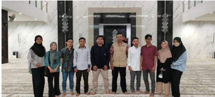
Gambar 1 1 Kegiatan Inkubasi Bisnis Hari Pertama

4.1.1 Kegiatan inkubasi hari pertama , seluruh mahasiswa wmk melakukan kegiatan pendampingan sesuai dengan kelompok magang masing-masing. Inkubasi yang dilakukan oleh kelompok magang dari INES QUEENS melakukan pendampingan perdana di Masjid Al-Istiqomah Politeknik Negeri Jember. Kegiatan inkubasi pertemuan pertama adalah melakukan sebuah pengenalan diri masing-masing kepada pendamping.