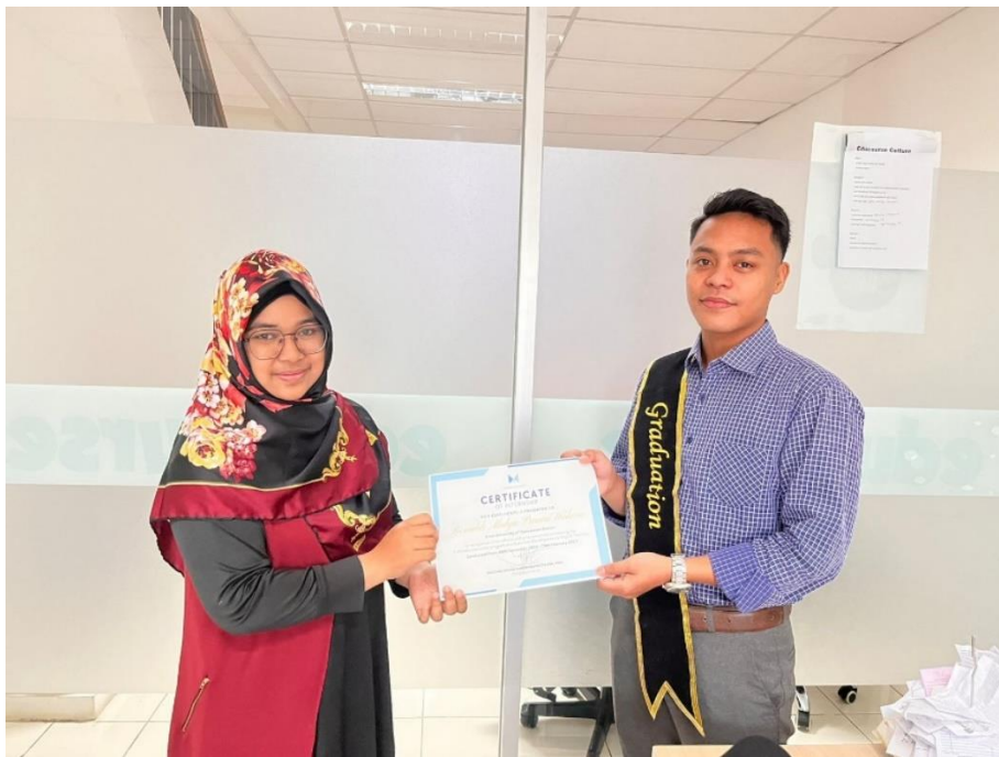
Gambar 7 Serah terima sertifikat PKL dengan CEO Educourse.id