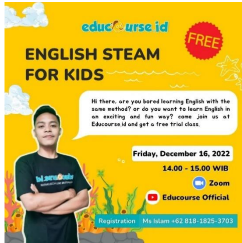
Gambar 5 Kegiatan mengajar English STEM for kids