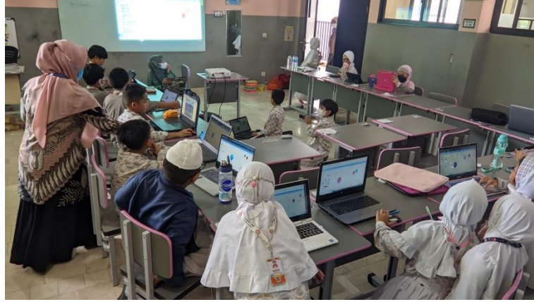
Gambar 3 Kegiatan mengajar coding for kids di Student one Islamic school