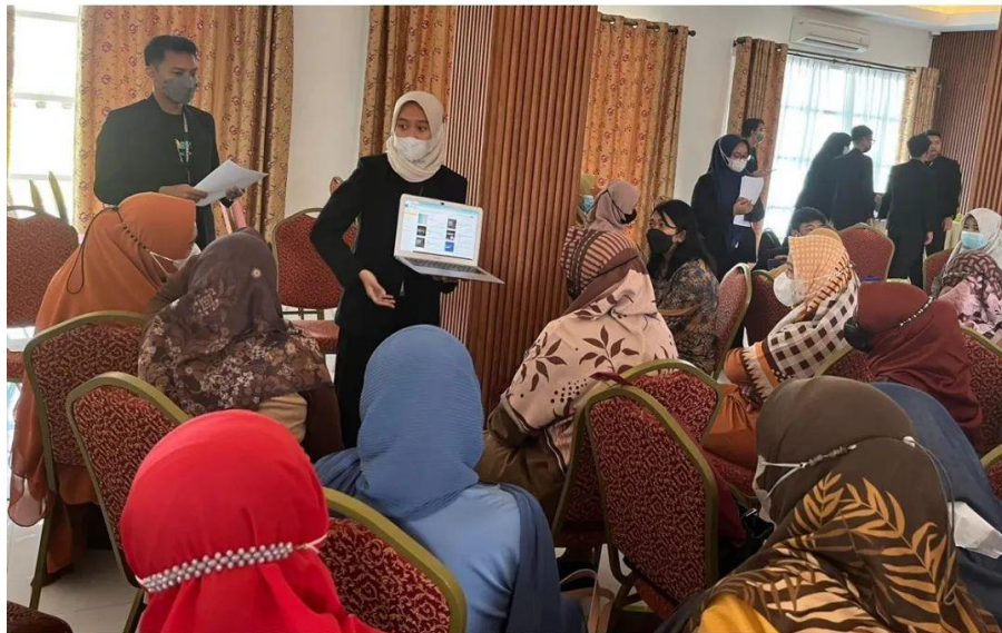
Gambar 6 Kegiatan Pembukaan GESSIT Tangerang