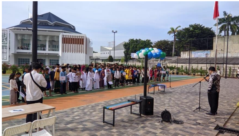
Gambar 4 Kegiatan perlombaan di pesantren modern tahfidz ar-rahmah Tangerang