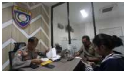
Gambar 1. 3 Liputan Patriot Jawi Wetan

Selain menjadi editor, peserta magang juga berkesempatan meliput berita yang bertugas menjadi seorang videographer. Kegiatan ini di lakukan untuk mendukung konten yang akan di unggah di media sosial Instagram dan TikTok berupa terjun langsung kelapangan. Ada beberapa liputan yang telah dilaksanakan peserta selama magang ini seperti; Liputan Kota Lama, Liputan Visit Sekawan Limo, Liputan Aniversay Harian Disway, Liputan Fun Walk JCC, Liputan Joki Strava, Liputan KoCi Jatim 2024, Liputan Jazz Gunung Bromo, Liputan Patriot Jawi Wetan, Liputan Persebaya, Liputan Freed Ballet, Liputan Telisik Bangunan Bersejarah, Liputan Demo, dan Liputan Beasiswa ke Tiongkok. Berikut beberapa liputannya;