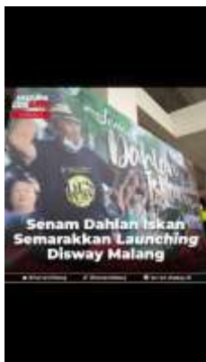
Gambar 1. 10 Thumbnail

Selain beberapa tugas di atas peserta juga membantu tugas divisi lain yang masih dalam satu tim sosmed yaitu desain grafis. Pada tugas ini peserta mendesain postingan untuk Instagram, thumbnail untuk video dan cerita pada instagram kurang lebih 12 desain grafis. Berikut beberapa contoh desain yang telah di buat oleh penulis: