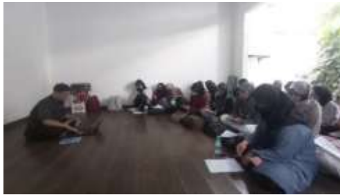
Gambar 1. 12 Pelatihan EYD