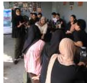
Gambar 1. 15 Kumpul Pembagian Tugas

Karena ini merupakan sebuah tim, maka perlu adanya kontribusi saling membantu dalam membuat konten berita. Untuk menyukseskan dan mencapai tujuan bersama dan menuntaskan target perbulannya.