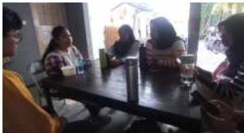
Gambar 1. 14 Meeting Koordinasi