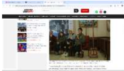
Gambar 1. 5 Liputan Jazz Gunung Gambar 1. 6 Liputan Pers Conference Jazz Gunung Bromo