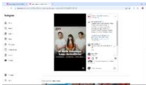
Gambar 1. 7 VO Entertainment

Dalam kegiatan ini peserta magang bertugas menjadi voice over man yang memiliki peran penting dalam proses penyampaian informasi sebagai pelengkap dalam sebuah konten video. VO man bertanggung jawab untuk menyuarakan naskah berita, menyesuaikan intonasi dan ekspresi suara, serta memastikan sinkronisasi dengan visual. Selama magang ini peserta setidaknya telah mengisi suara 3 konten video, yaitu;