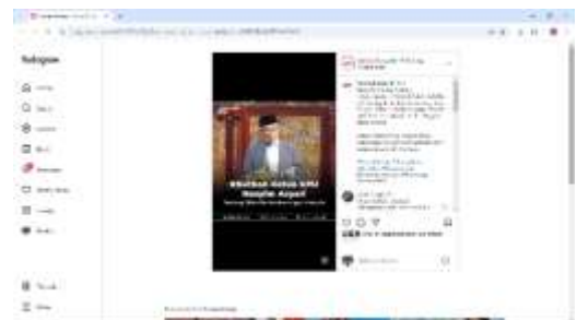
Gambar 1. 2 Editing Flash News