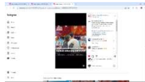
Gambar 1. 8 VO Entertainment