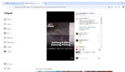
Gambar 1. 9 VO Entertainment