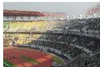
Gambar 1. 4 Liputan Persebaya