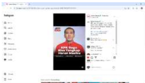
Gambar 1. 1 Editing Konten DHI

yaitu pada tanggal 14 Juni 2024. Diawal kegiatan editing ini peserta magang masih beradaptasi, sehingga masih banyak kekurangan khususnya dalam kecepatan mengedit, karena media berita kejar tayang konten agar berita tidak basi. Dalam kegiatan editing konten DHI disini peserta menjadi editor video yang sudah di siapkan oleh PIC Brief. Selama melakukan magang peserta telah melakukan editing video kurang lebih sebanyak 43 konten DHI, 11 Flash News , 11 Highlight , dan 26 Editing Khusus yang sudah di unggah di Instagram sesuai dengan tabel yang ada diatas: