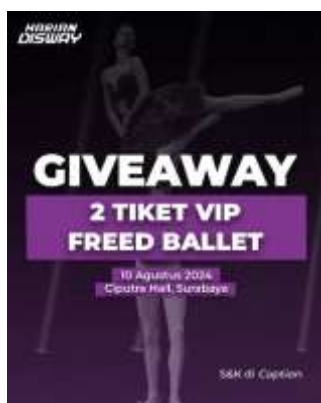
Gambar 1. 11 Postingan Instagram