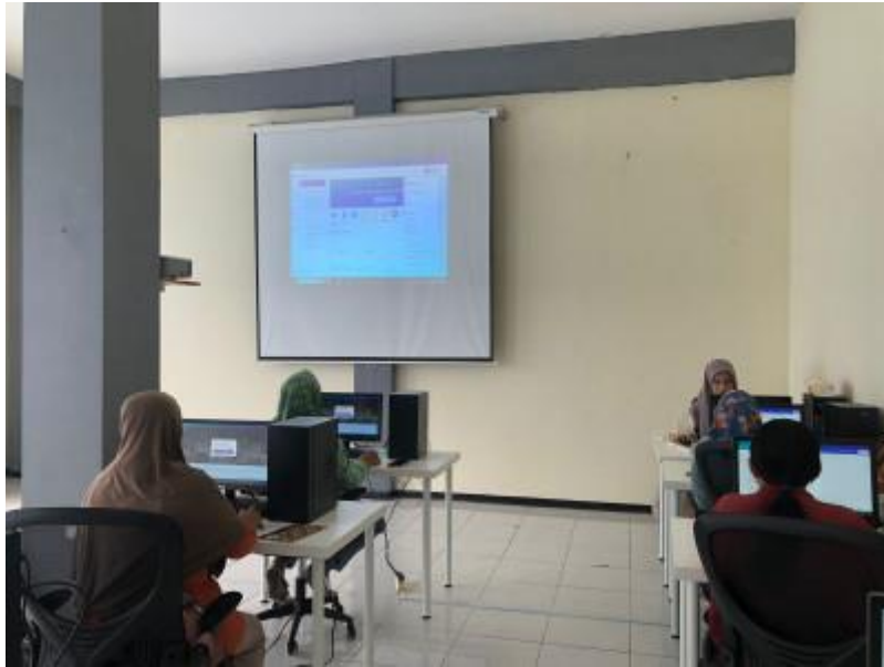
Gambar 3. Pelatihan materi Canva pada jadwal sesi yang telah ditentukan