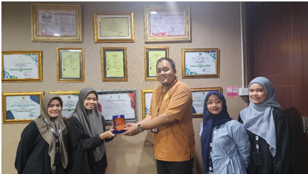
Gambar 6. Penyerahan Cendramata kepada Pembimbing PKL