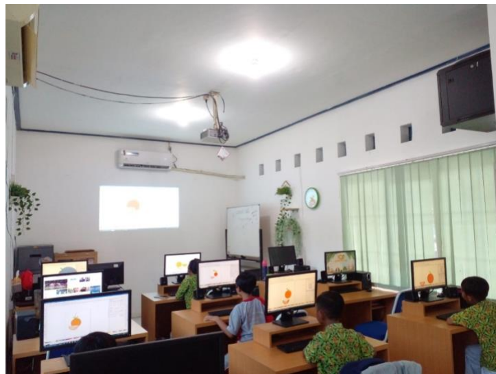
Gambar 4. Pengunjung siswa SD sedang memanfaatkan fasilitas BLC