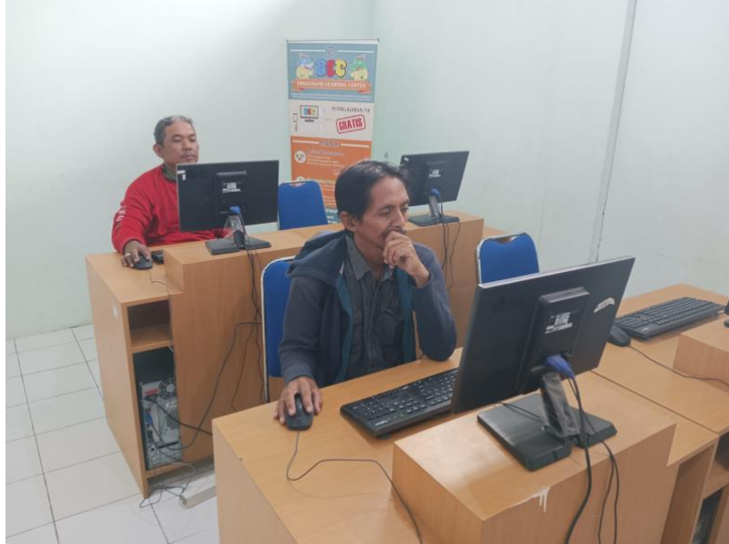
Gambar 1. Simulasi PPP di BLC