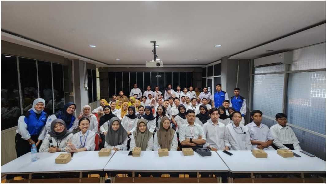
Gambar 5. Workshop Literasi Digital