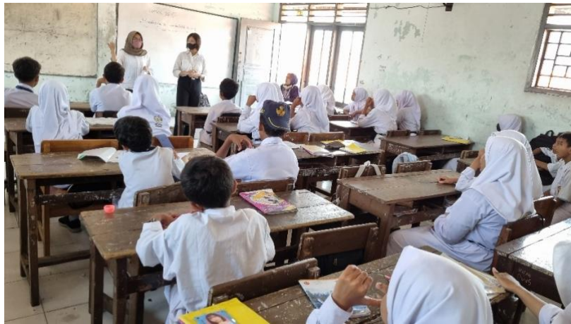
Gambar 2. Sosialisasi pengenalan BLC kepada siswa SMP Cahaya Surabaya