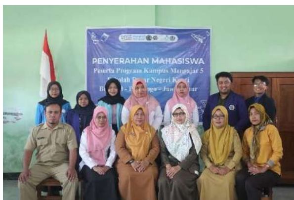
Gambar 3 Penyerahan Mahasiswa