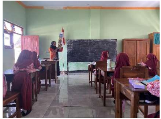
Gambar 14 English Fun