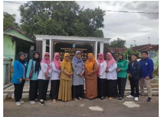
Gambar 2 Koordinas ke Sekolah Penempatan