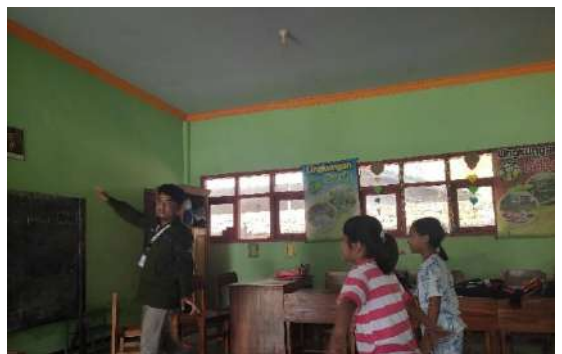
Gambar 19 Tari