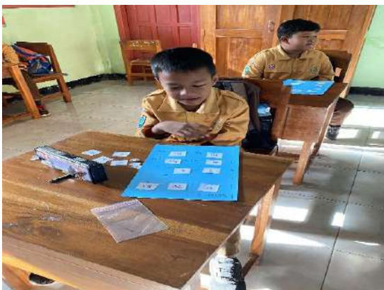
Gambar 5 Pembiasaan Numerasi