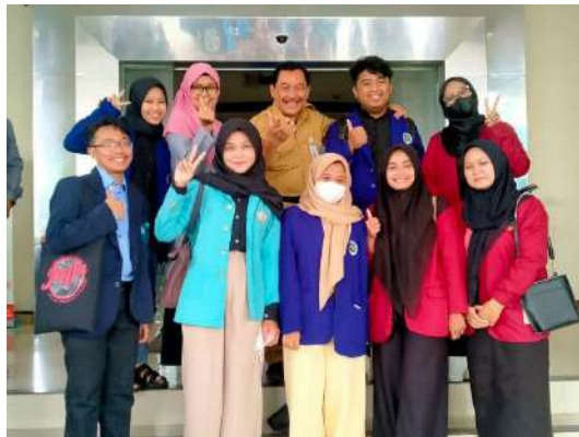
Gambar 1 Laporan ke Dinas Ponorogo