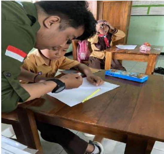
Gambar 13 Math Fun