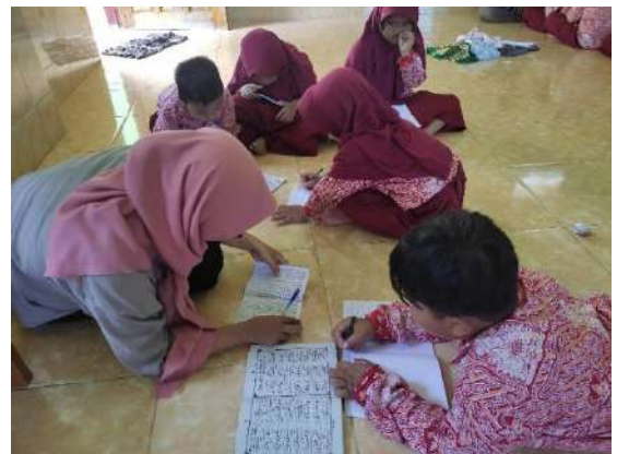
Gambar 6 Baca Tulis Al Qur'an