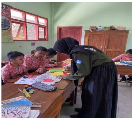
Gambar 11 Membantu pembelajaran seni rupa yang lebih kreatif dan menarik