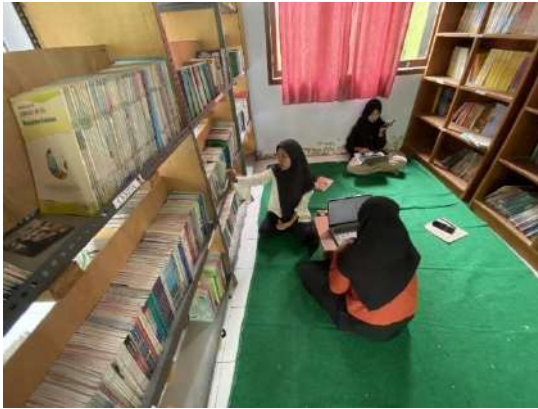
Gambar 1 Wajah Baru Perpustakaan