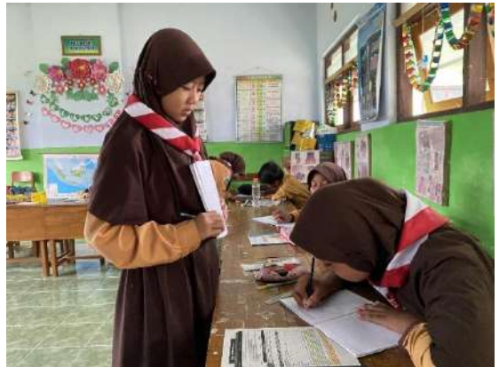
Gambar 16 Literasi dan Numerasi Kelas 5