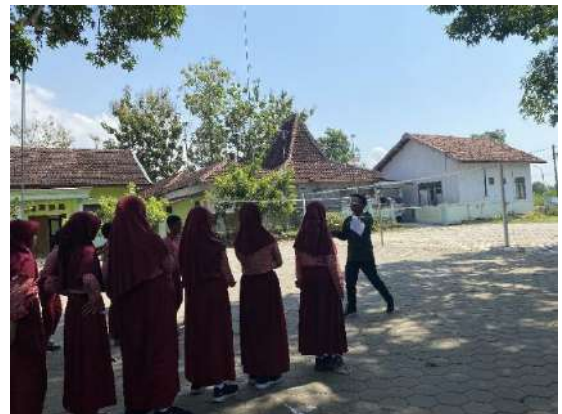
Gambar 17 Kegiatan Kepramukaan