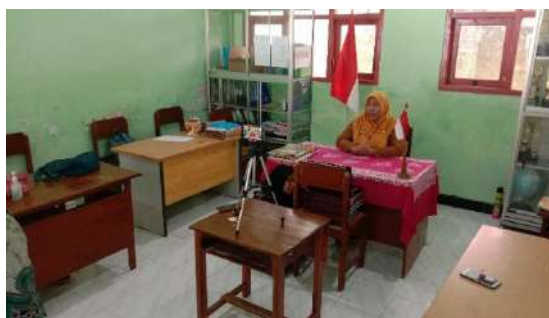
Gambar 9 Video Selayang Pandang