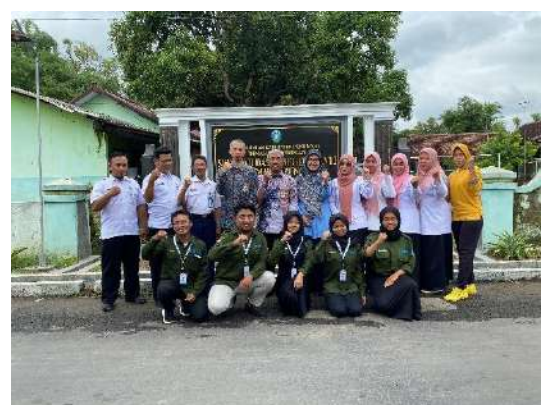
Gambar 4 Monev Dinas Provinsi