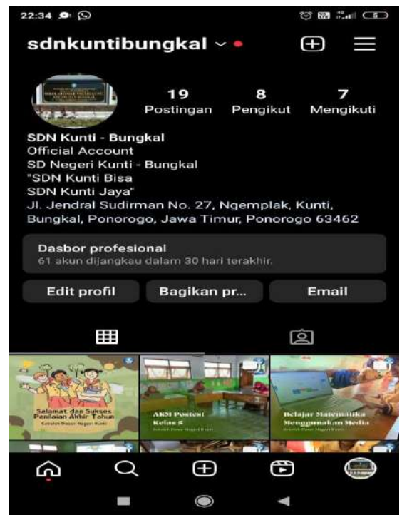
Gambar 10 Sosial Media