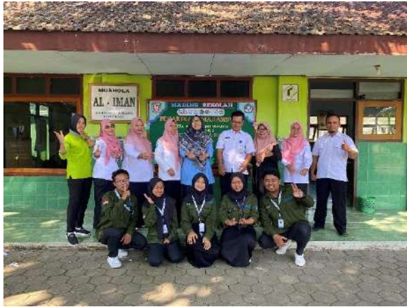
Gambar 5 Penarikan Mahasiswa