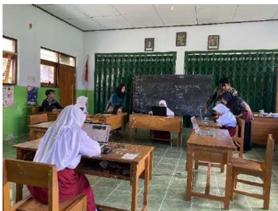
Gambar 18 Evaluasi Literasi dan Numerasi Kelas 5