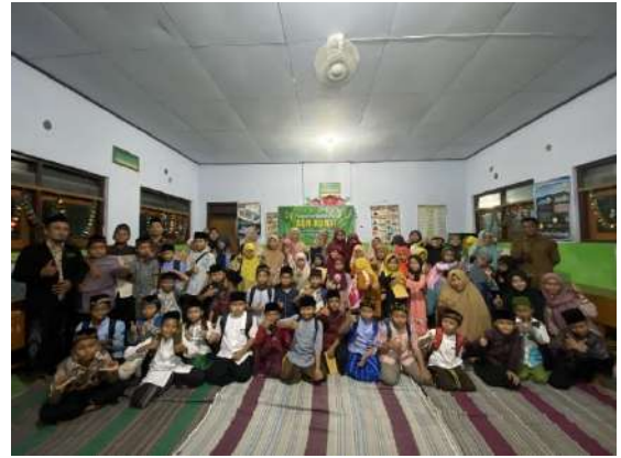
Gambar 8 Pondok Ramadhan