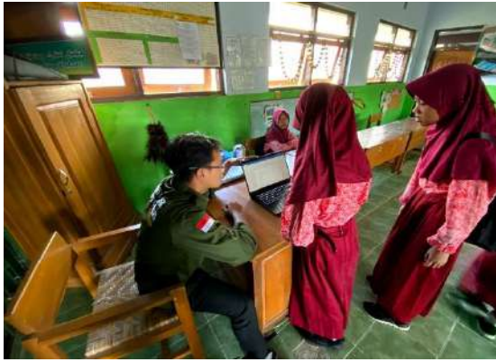
Gambar 20 Adaptasi Teknologi