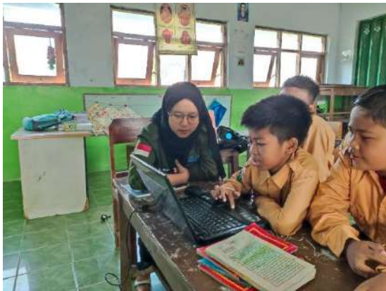
Gambar 1 Konseling