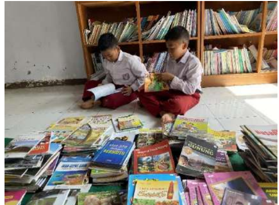
Gambar 2 Pemberdayaan Perpustakaan