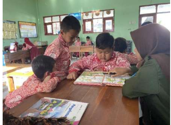
Gambar 4 Pembiasaan Literasi