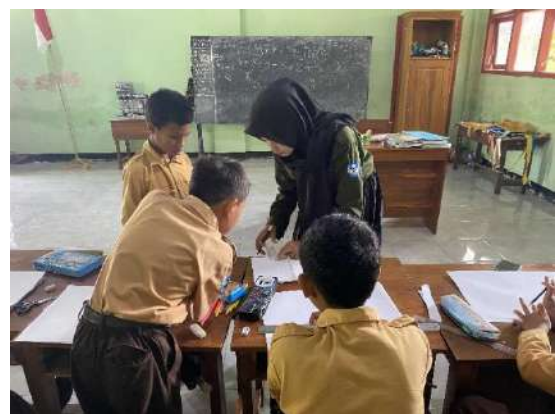
Gambar 12 Les Menggambar untuk mengembangkan minat dan bakat dalam diri siswa