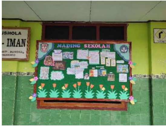
Gambar 7 Mading Sekolah