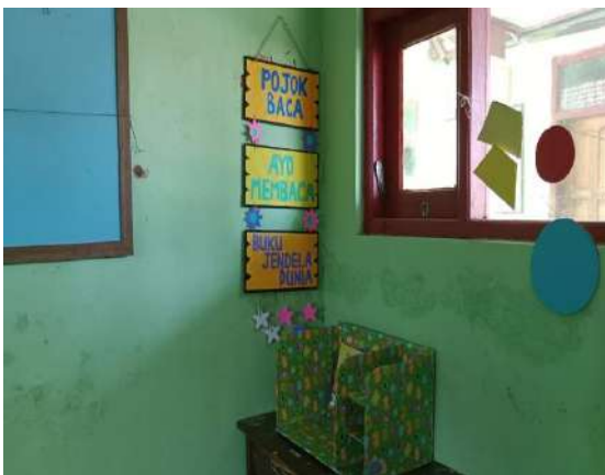
Gambar 3 Pojok Baca