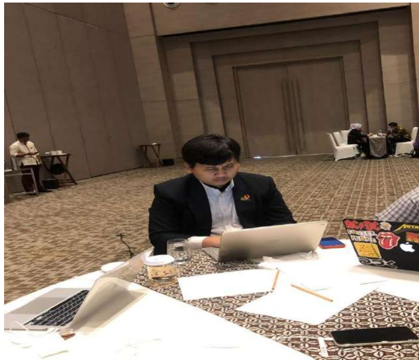
Gambar 6: Menjadi Notulensi dan LO di acara Asia Pasific Training for Effective Developmnet Cooperation