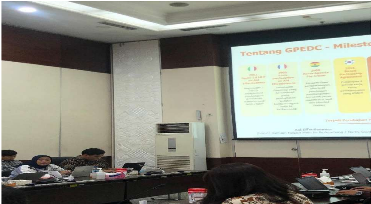
Gambar 3: Mengikuti FGD Private Sector Engagement in Effective Development Cooperation