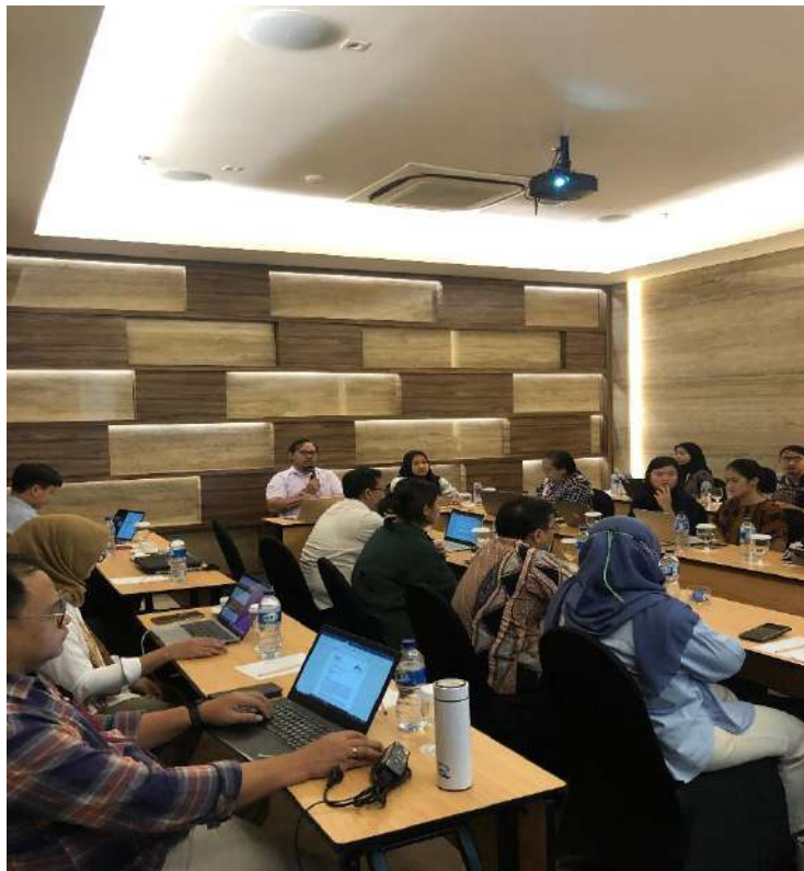
Gambar 4: Mengikuti FGD CSO role in PSE