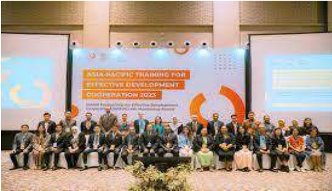
Gambar 0.5: Mengikuti Asia Pasific Traing for Effective Development Cooperation