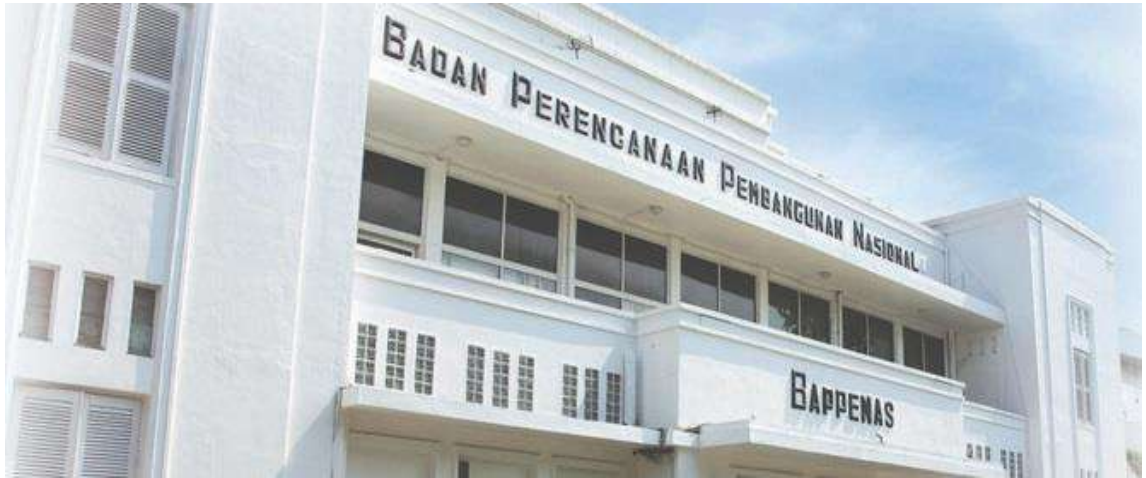
Gambar 1: Gambar Gedung Bappenas Taman Suropati