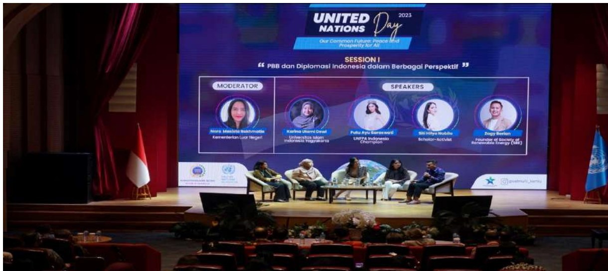
Gambar 2: Mengikuti Acara UN Day ke-73