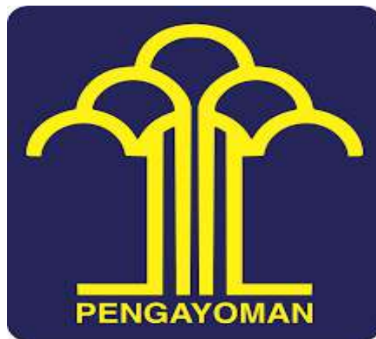
Gambar 2.1 Logo dari Kementerian Hukum dan HAM

Ketentuan Pasal 6 dalam Peraturan Menteri Hukum dan Hak Asasi Manusia Nomor M. HH- 05.UM.01.01 Tahun 2011 tentang Logo Kementerian Hukum dan Hak Asasi Manusia (Berita Negara Republik Indonesia Tahun 2011 Nomor 433) diubah sehingga berbunyi sebagai berikut 2 :