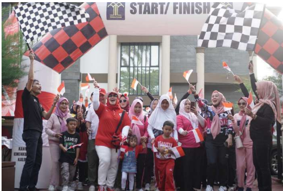
Kegiatan Diseminasi Penguatan PPNS