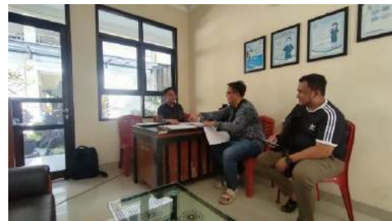
Foto 4. Penetapan ahli waris

Dokumentasi lengkap bisa diperoleh dari link berikut: