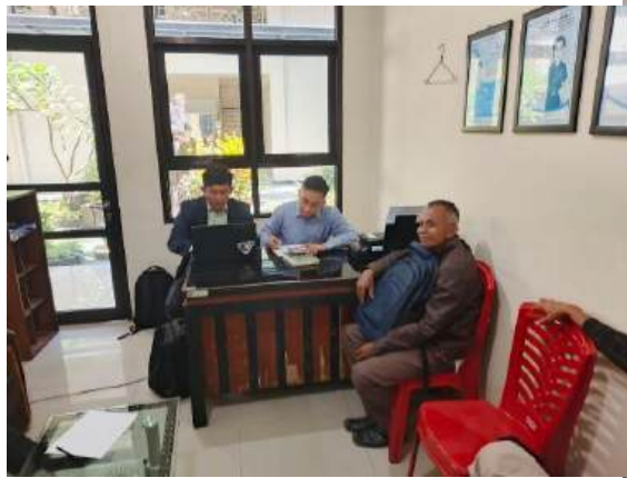
Foto 1. Memberikan bantuan hukum