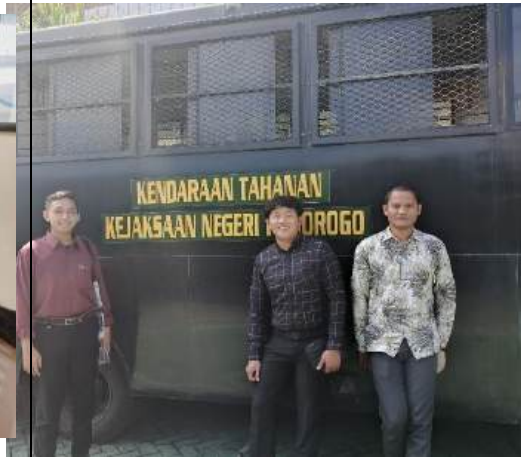
Foto 2. Penasehat hukum terdakwa