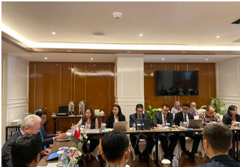
Foreign Policy Circle Talks: Indonesia - Belarus Towards Economic Collaboration