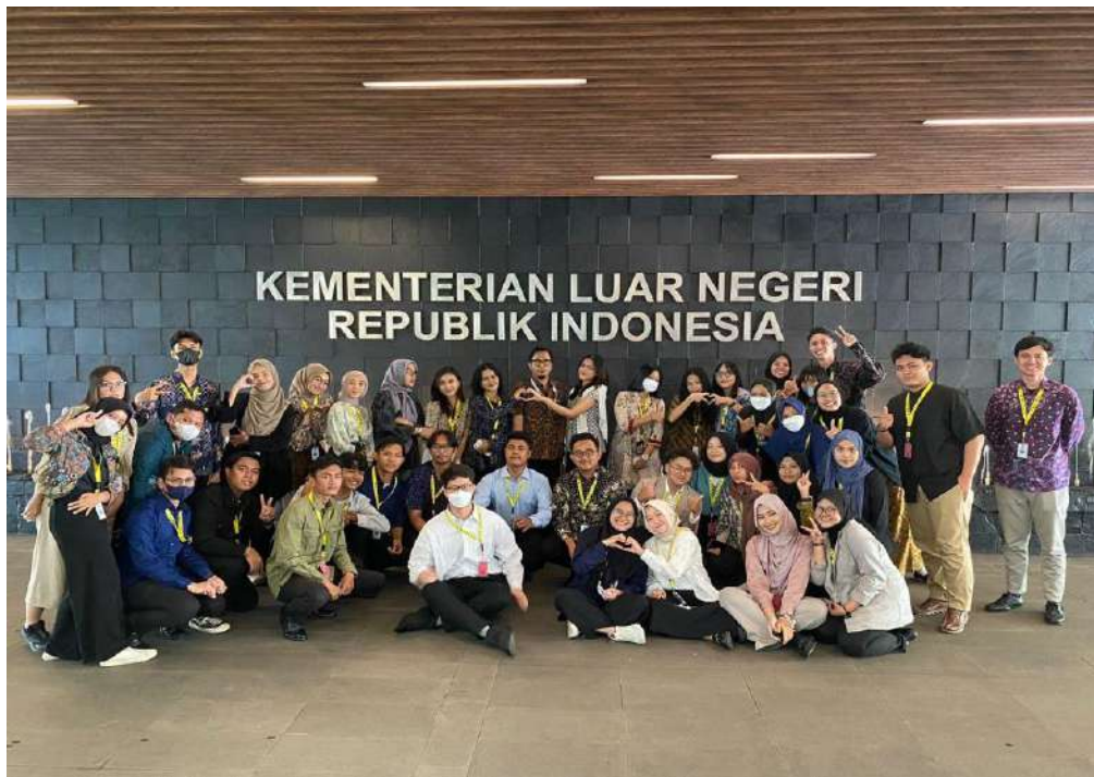
Gedung Kementerian Luar Negeri Republik Indonesia