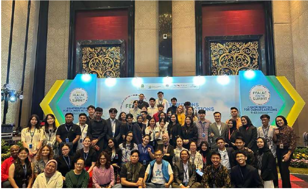
Fealac Agenda From Direktorat KSIA AMEROP, Bandung