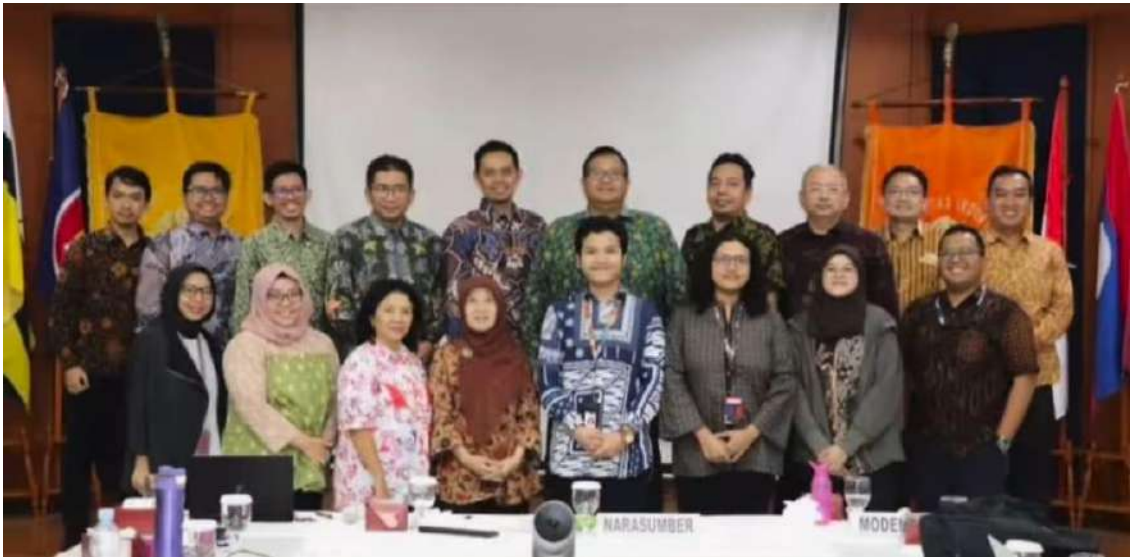
Pertemuan Kelompok Ahli (PKA) Reviu Kebijakan Mandiri “Implementasi Rekomendasi UN Global Crisis Response Group (GCRG)