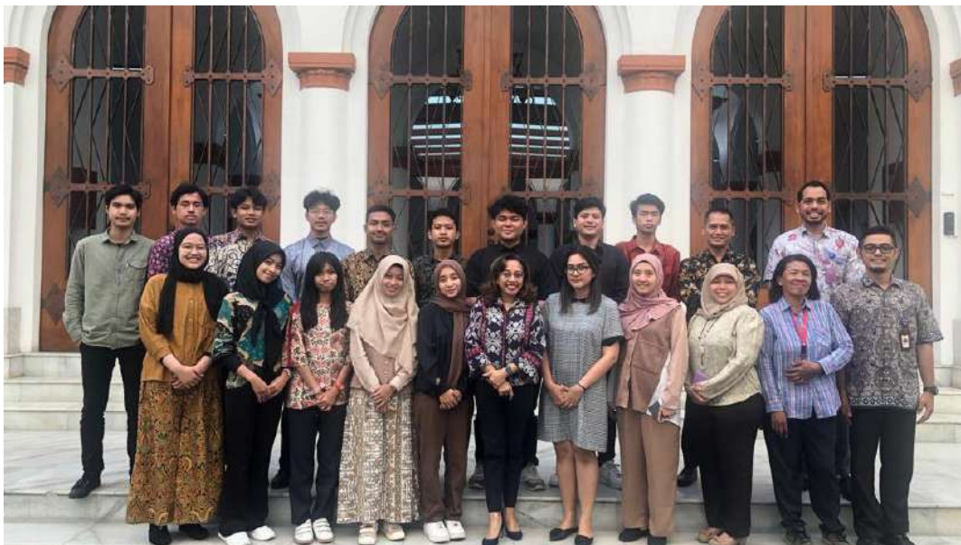
Kementerian Luar Negeri Republik Indonesia Pusat Strategi Kebijakan Kawasan Amerika dan Eropa