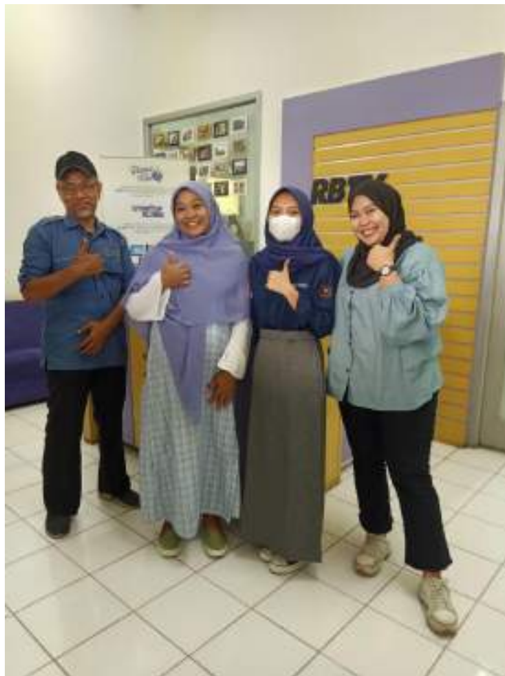
Gambar 18 Visitasi Dosen ke tempat magang