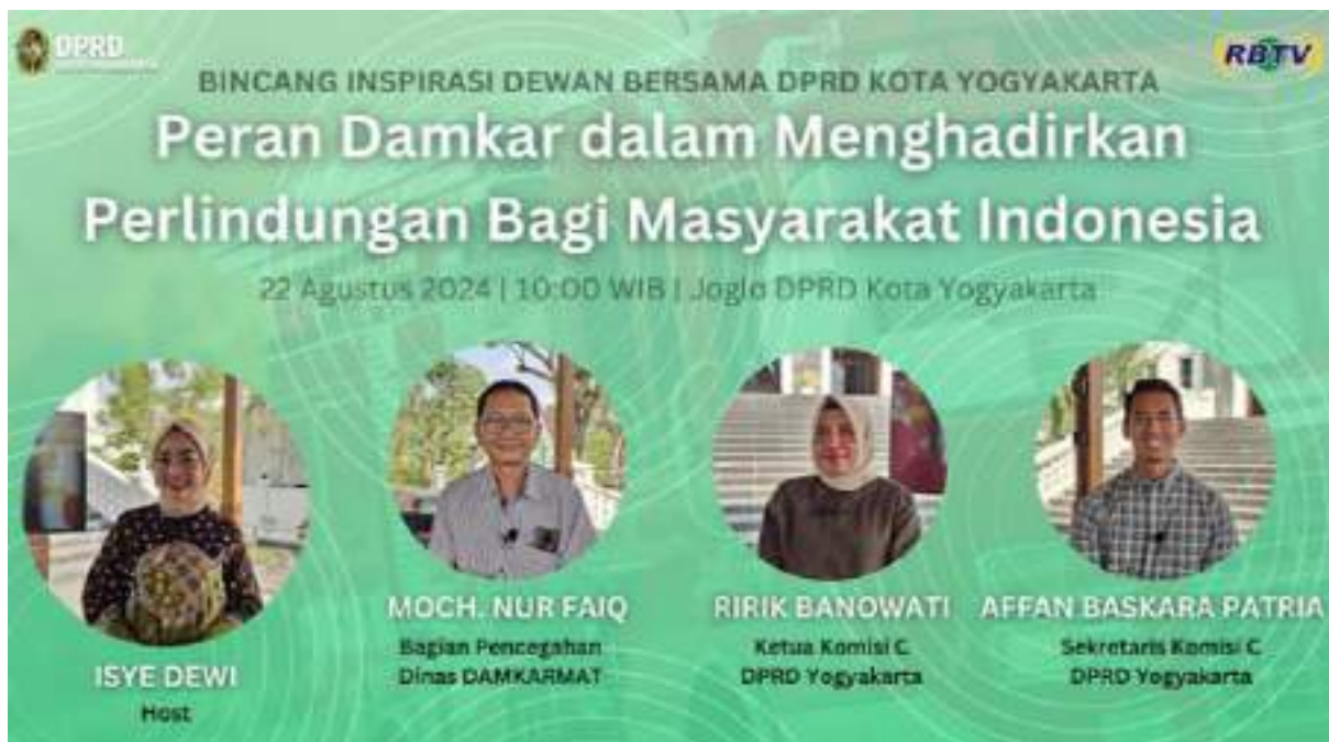
Gambar 12 Thumbnail YouTube program Bincang Inspirasi Dewan edisi peran Damkar