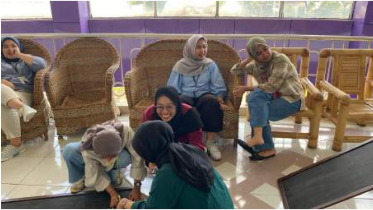
Gambar 17 Kegiatan HUT RBTV