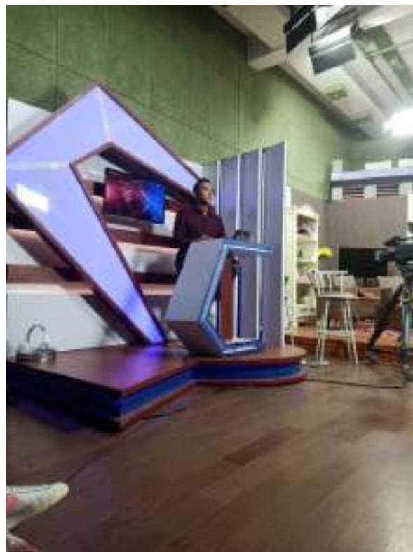
Gambar 7 Orientasi Produksi Siaran Kabar Jogja