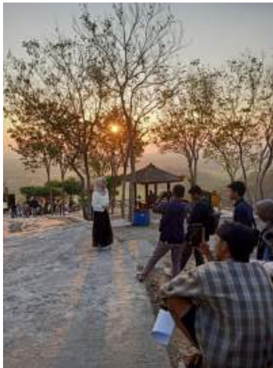
Gambar 10 Proses produksi feature di Puncak Sosok

PUNCAK SOSOK/ JUGA MENYEDIAKAN BERAGAM SPOT FOTO MENARIK/ UNTUK MENGABADIKAN MOMEN INDAH/ BAGI PARA WISATAWAN NYA// ADA PULA PANGGUNG HIBURAN/ YANG BIASA NYA DIGUNAKAN UNTUK PERTUNJUKAN LIVE MUSIC// YANG MENAMBAH KESAN MERIAH SAAT MALAM HARI// TIDAK HANYA ITU/ PUNCAK SOSOK JUGA BISA DIJADIKAN SEBAGAI CAMPING GROUND// YANG MANA PARA PENGUNJUNG/ BISA BERKEMAH UNTUK BISA MERASAKAN BERMALAM DI ALAM TERBUKA// UNTUK BISA MENIKMATI PUNCAK SOSOK/ WISATAWAN DIKENAKAN TARI SEBESAR LIMA RIBU RUPIAH SEBAGAI TIKET MASUKNYA//