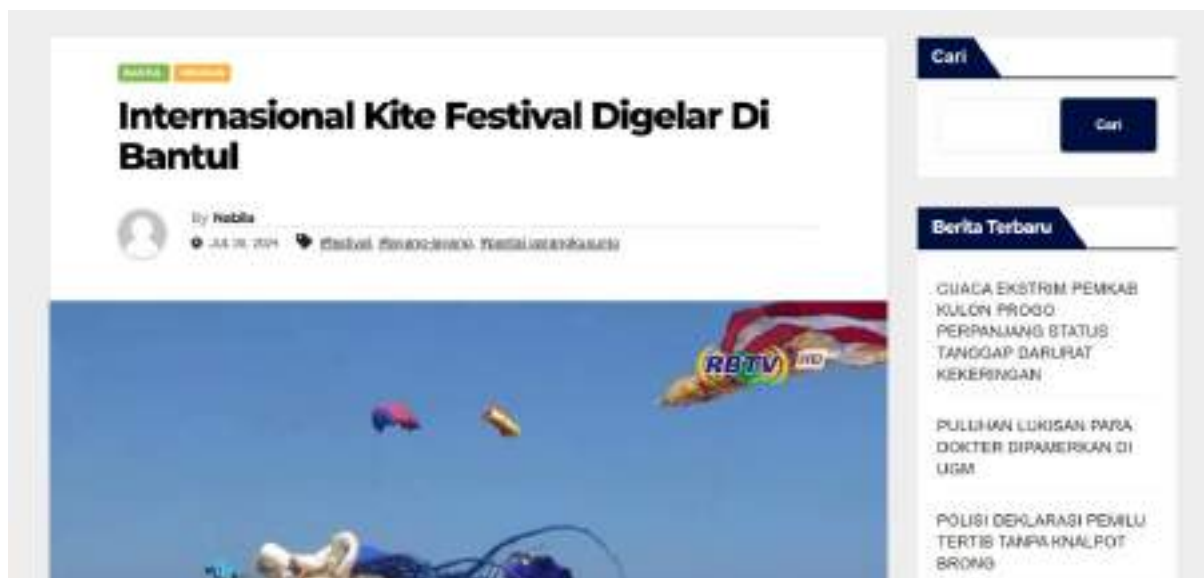
Gambar 5 Berita Mandiri

"Bisa sebulan mas, ini layang-layang Hanoman mas, kita kan Jawa mas jadi nya Hanoman, wayang, ciri khas Jawa. Bikinnya itu bisa lebih sekitar enam bulanan, satu tahun. Bahannya itu make kain stop, stop luar biasanya. Kalau yang dinilai itu keterampilan sama bagus nya, bentuk-bentuk nya juga" Bayu, Peserta Festival Layangan.