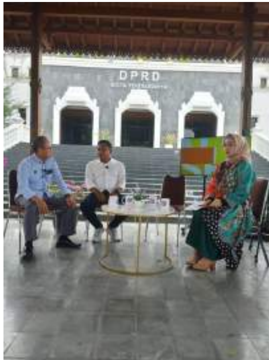
Gambar 14 Produksi berita bersama DPRD Yogyakarta terkait Digitalisasi di Jogja

sebuah hubungan kerja sama dan menjaga agar hubungan tetap berjalan dengan baik dengan pihak atau instansi yang bersangkutan.