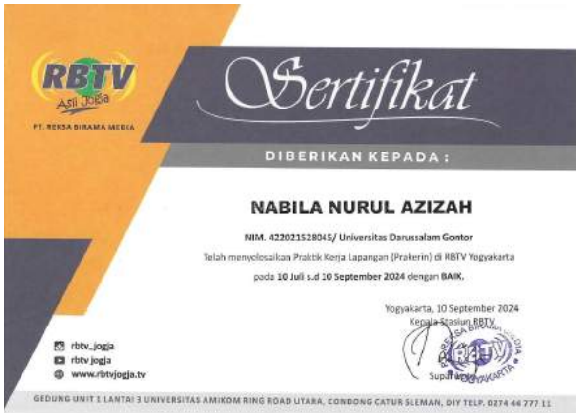
Lampiran 6 Sertifikat Magang