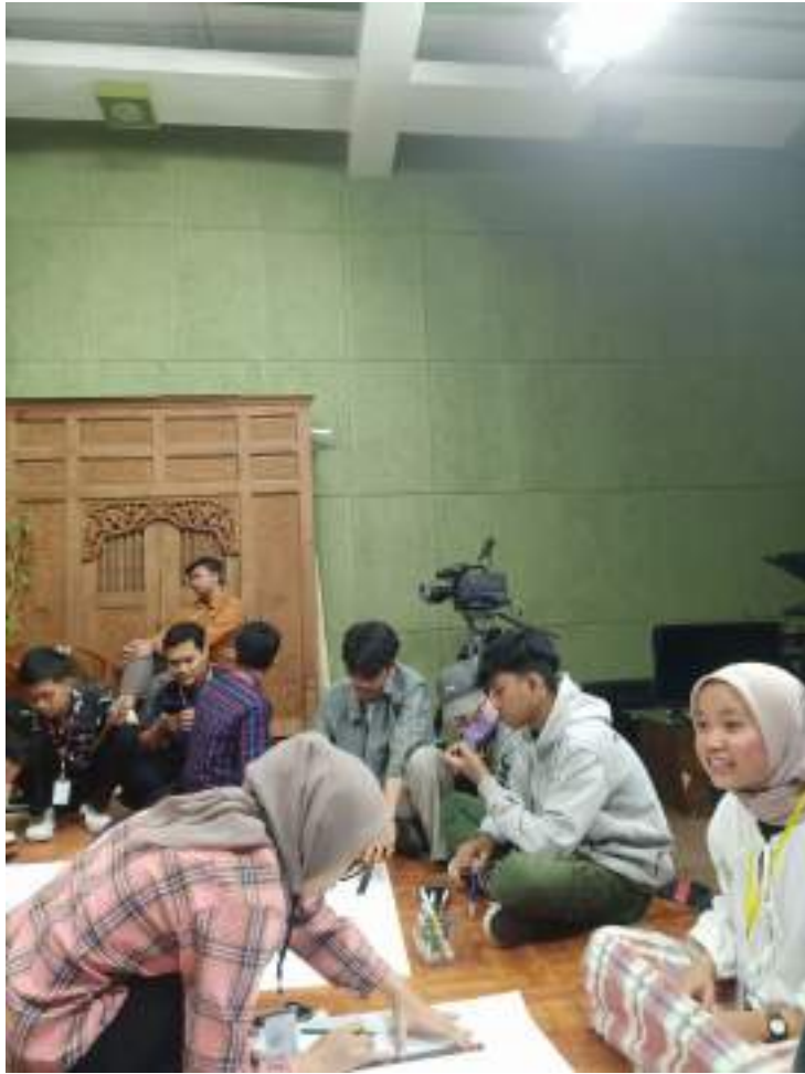
Gambar 19 Kegiatan HUT RBTV