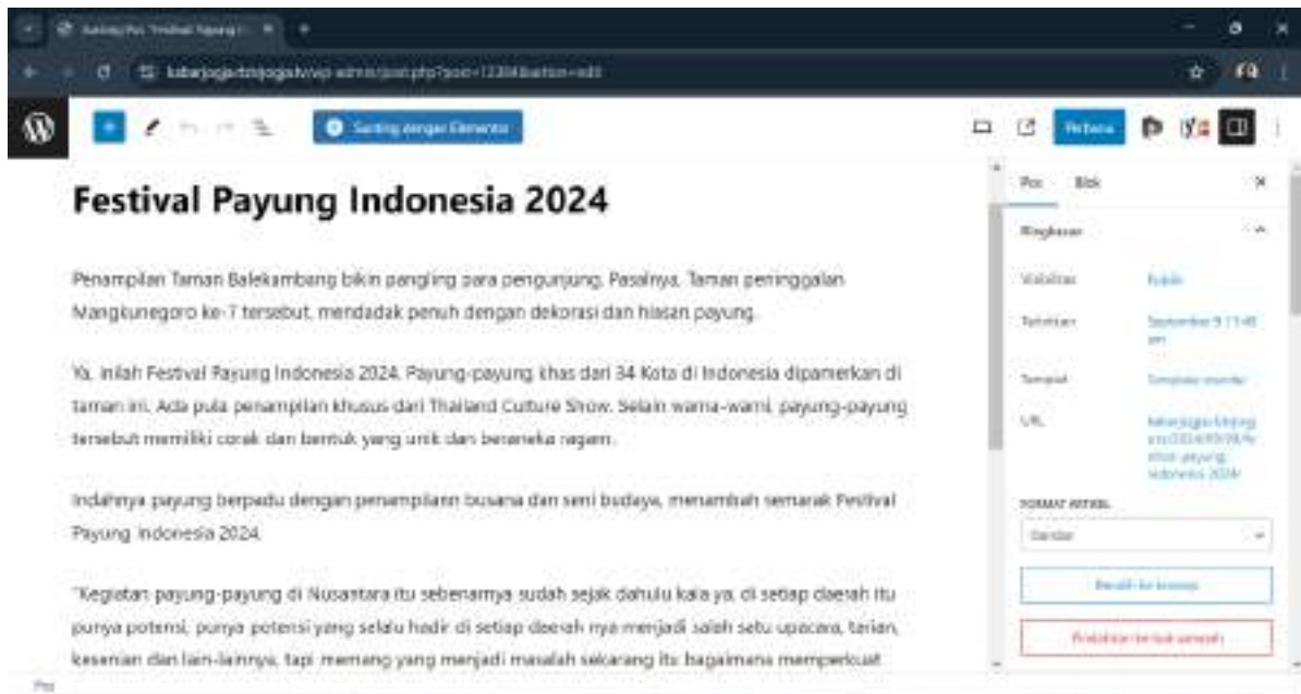
Gambar 4 Penulisan berita dalam website resmi RBTV Jogja