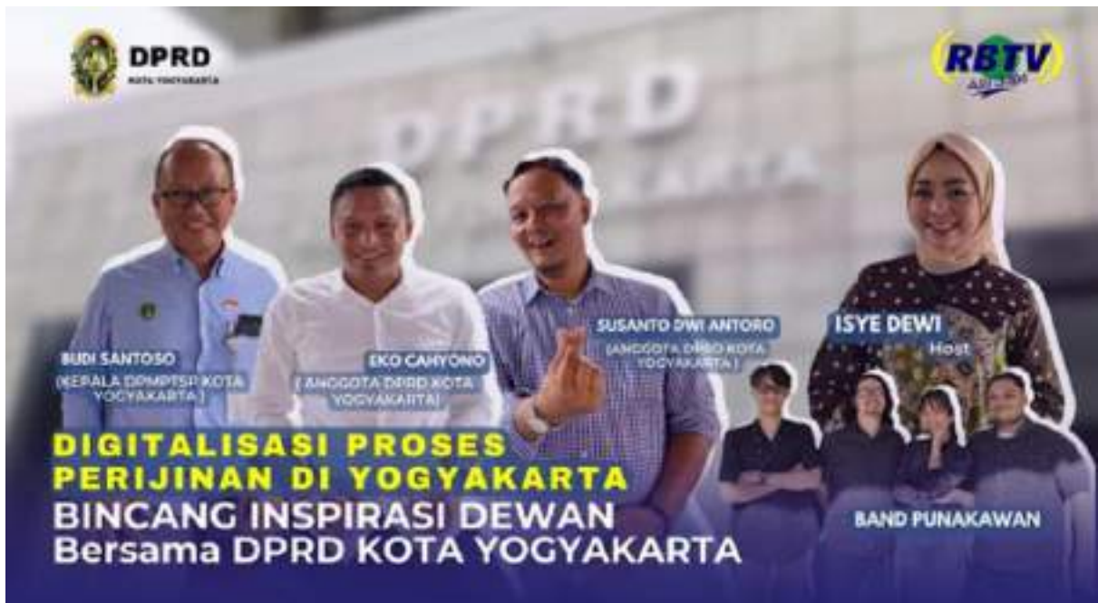
Gambar 15 Thumbnail YouTube program Bincang Inspirasi Dewan edisi digitalisasi Jogja