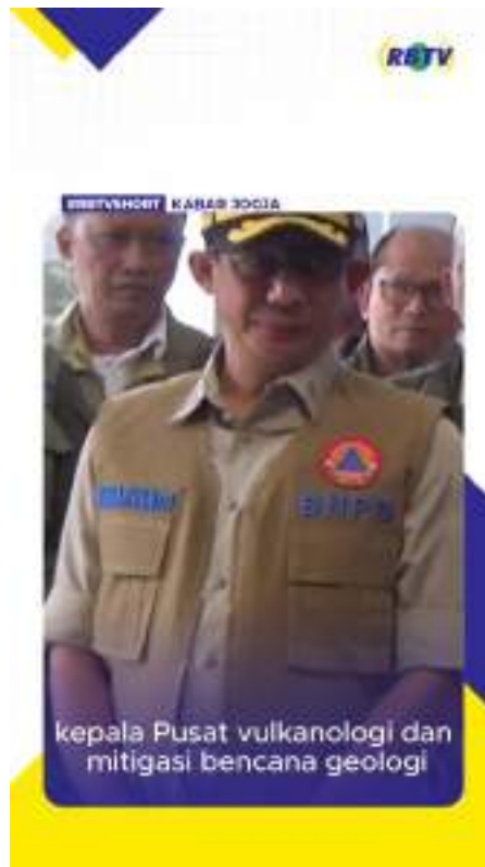
Gambar 9 Short YouTube program acara Kabar Jogja