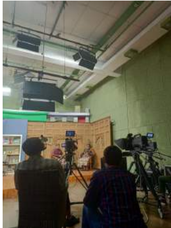
Gambar 6 Orientasi Produksi Program Leyeh-Leyeh