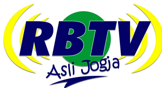
Gambar 1 Logo RBTv Jogja