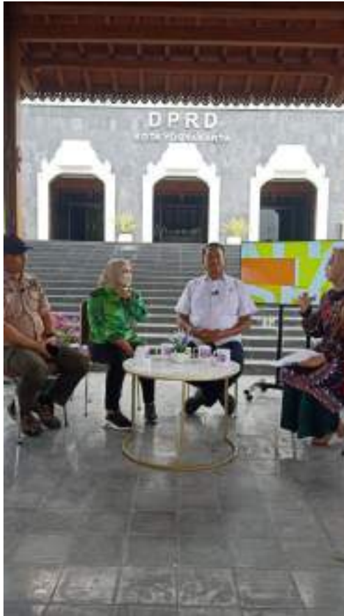
Gambar 13 Produksi berita bersama DPRD Yogyakarta terkait penanggulangan Megathrust