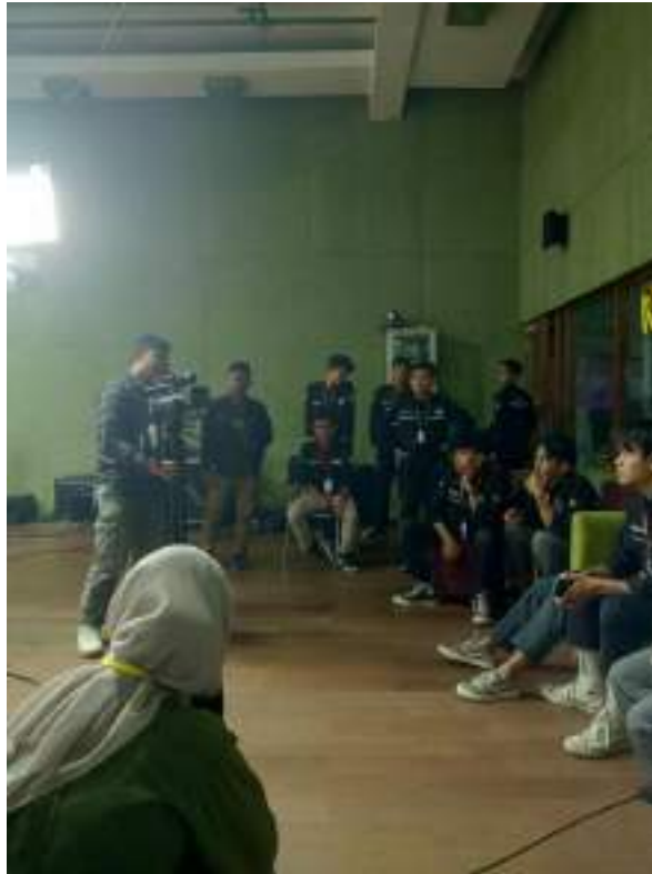
Gambar 8 Orientasi Penggunaan Alat Produksi