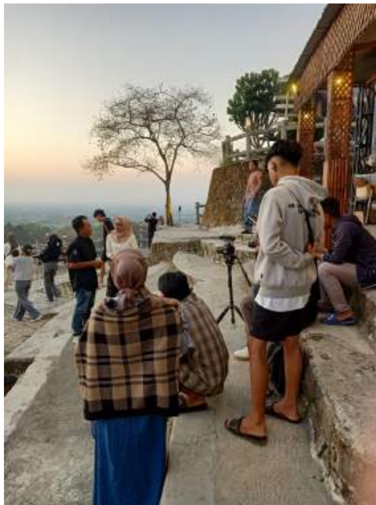
Gambar 16 Proses Wawancara Feature