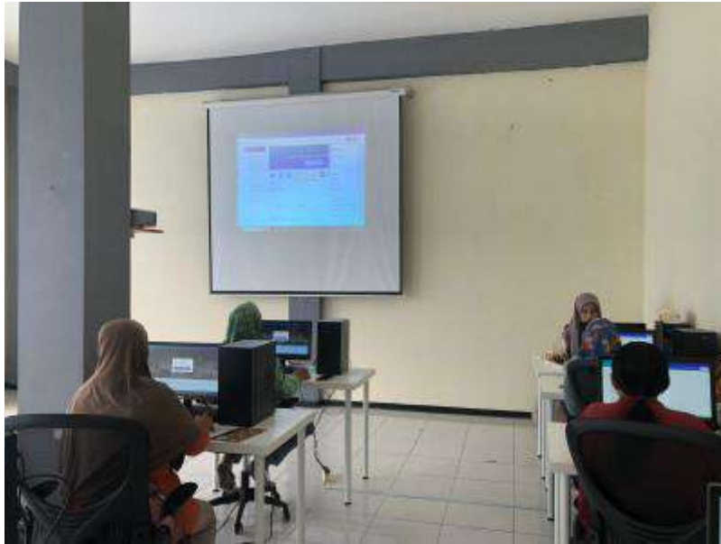
Gambar 3. Pelatihan materi Canva pada jadwal sesi yang telah ditentukan