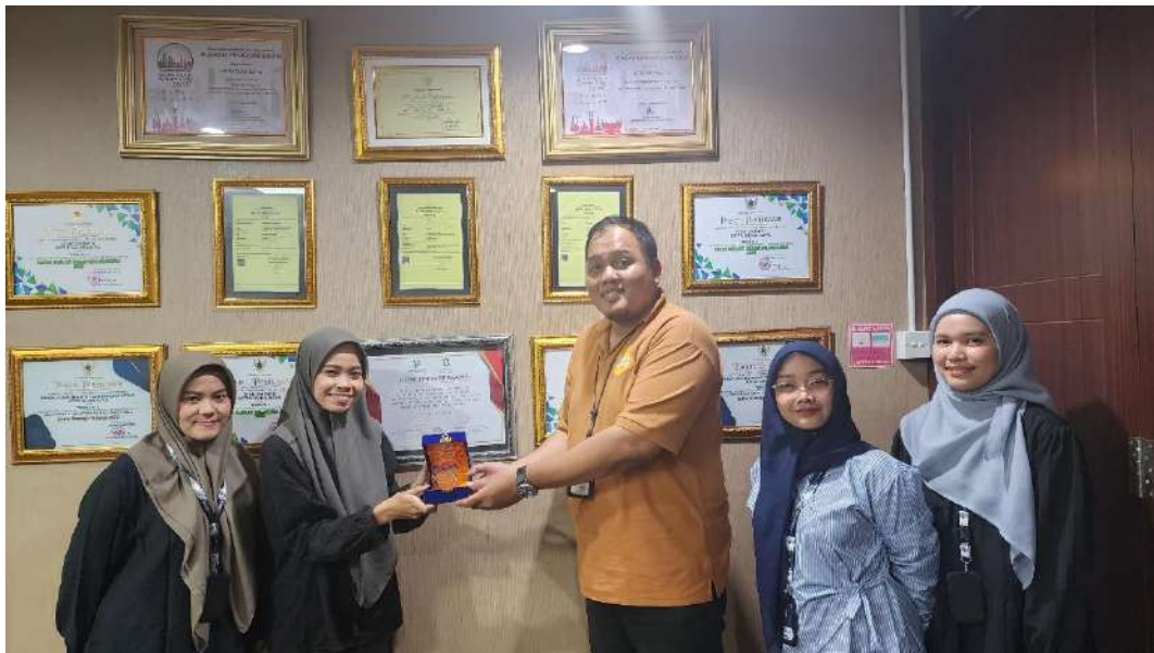
Gambar 6. Penyerahan Cendramata kepada Pembimbing PKL