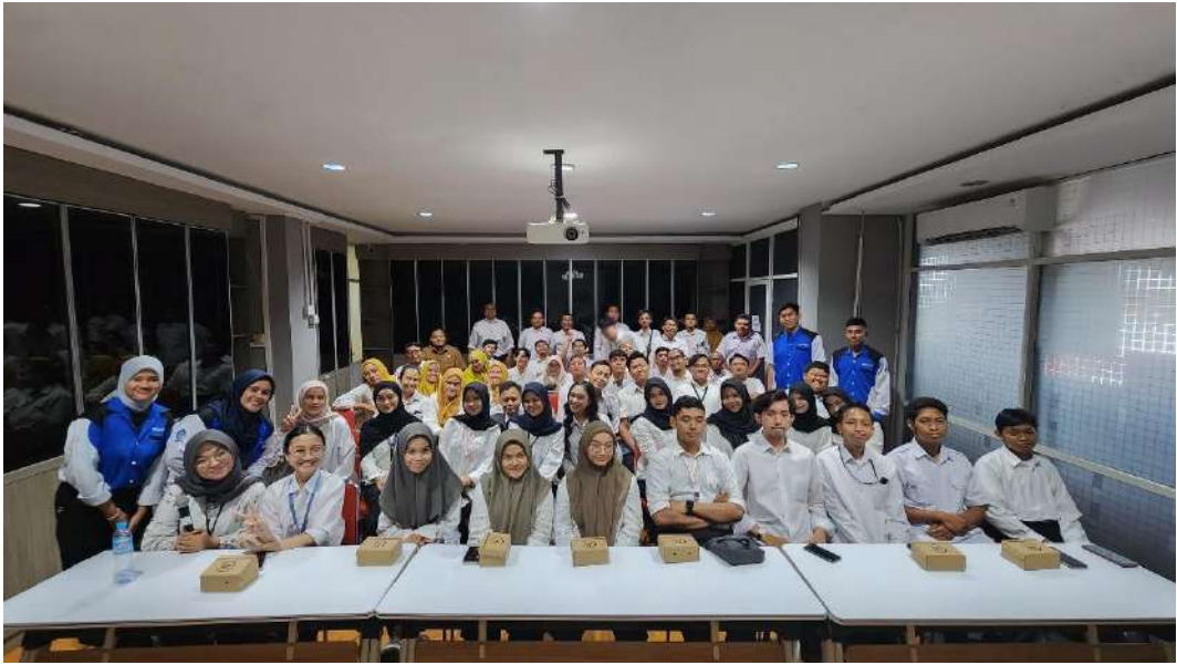
Gambar 5. Workshop Literasi Digital