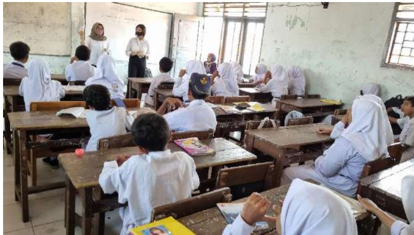
Gambar 2. Sosialisasi pengenalan BLC kepada siswa SMP Cahaya Surabaya