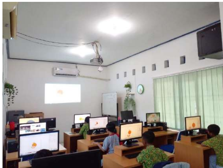
Gambar 4. Pengunjung siswa SD sedang memanfaatkan fasilitas BLC