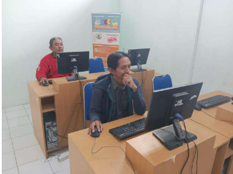
Gambar 1. Simulasi PPP di BLC