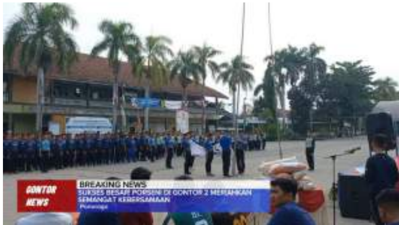
Gambar 17. Liputan penutupan acara PORSENI di Gontor 2