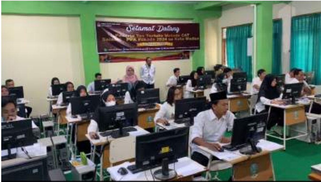
Lampiran 1. Liputan PPPK Se-Kota Madiun