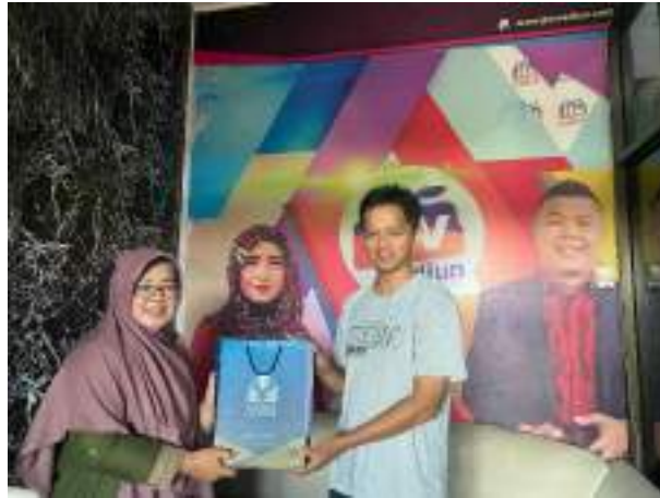
Gambar 19. Pemberian souvenir Unida Gontor kepada pihak JTV Madiun