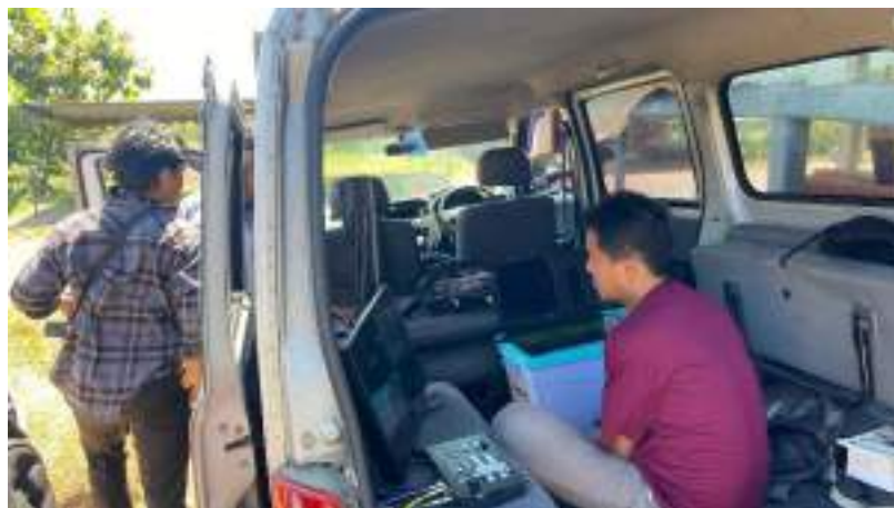
Gambar 7. Mahasiswa Bersama tim monitoring JTV Ketika persiapan acara

Mahasiswa beserta tim dari JTV Madiun menggelar persiapan acara sejak pagi hari untuk pelaksanaan acara pada sore harinya. Mahasiswa diberikan tugas untuk menyiapkan pemasangan kabel kamera ke mobil monitoring punya JTV Madiun serta menyiapkan proyektor tambahan untuk para tamu. Proses ini berlangsung dari pagi hari hingga selesai nya acara pada malam hari. Setelah usainya acara, mahasiswa beserta tim dari JTV Madiun menggelar evaluasi selesainya acara yang dilakukan dikediaman Mas Ega yang terletak di kecamatan Pulung.