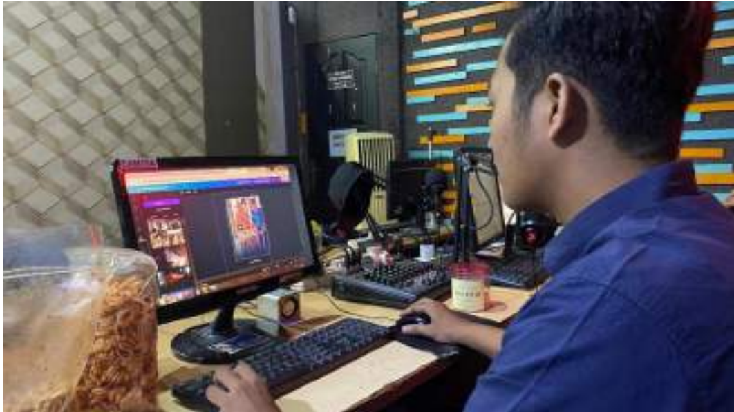
Lampiran 5. Mahasiswa Sedang Membuat Tumnil Youtube Dan Instagram JTV Madiun