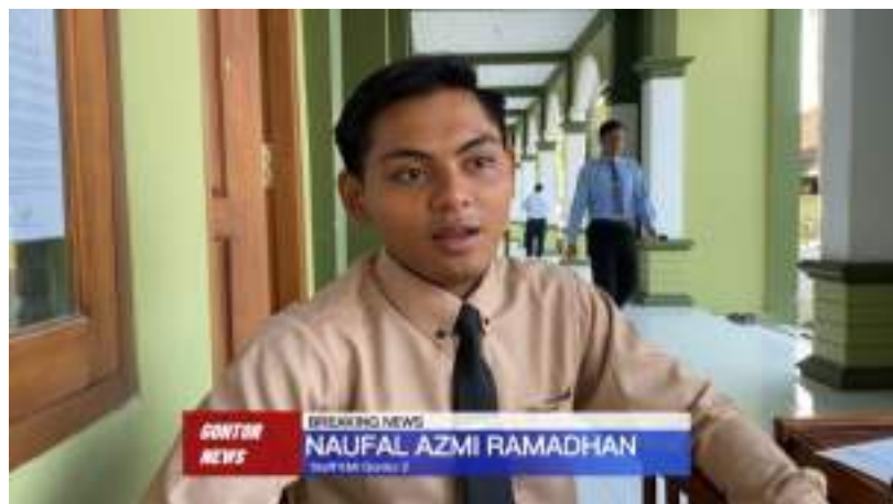
Gambar 13. Wawancara Bersama staff KMI Gontor 2