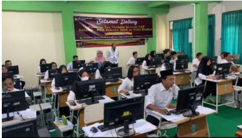
Gambar 8. Mahasiswa melihat kegiatan seleksi PPPK se-kota Madiun