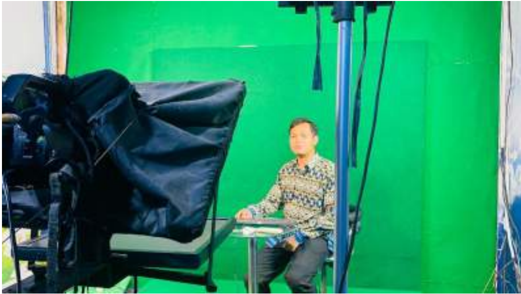
Lampiran 3. Orientasi tentang Jurnalistik dan pemberitaan