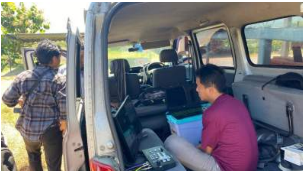
Lampiran 2. Liputan Streaming Halal Bihalal KH. Anwar Zahid