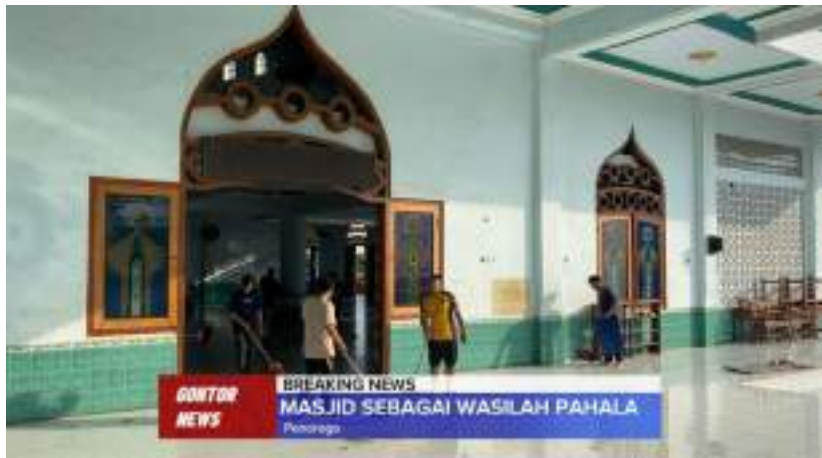
Gambar 14. Liputan tentang kegiatan membersihkan masjid di Gontor 2