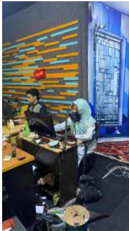
Lampiran 4. Voice Over Yang Dilakukan Oleh Karyawan Jtv Madiun