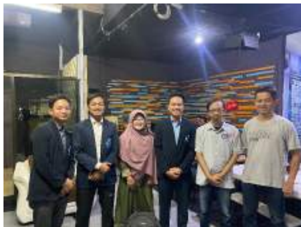
Gambar 20. Foto bersama pihak JTV Madiun