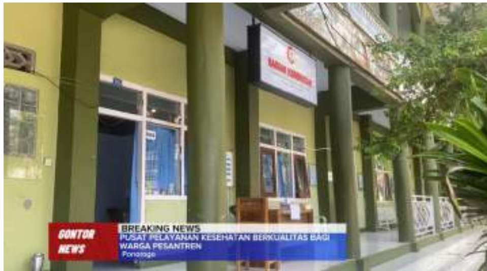
Gambar 18. Liputan Balai Kesehatan Gontor 2