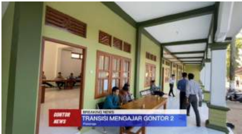
Gambar 12. Proses liputan tentang transisi mengajar Gontor 2