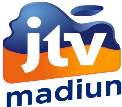
Gambar 2. Logo JTV Madiun tahun 2012-2022

biasa tidak kapital menambah bahwa JTV Madiun merupakan TV kebanggaan warga Jawa Timur. 8