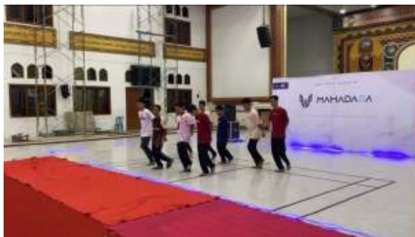
Gambar 15. Proses liputan gladi mahadasa show 2024