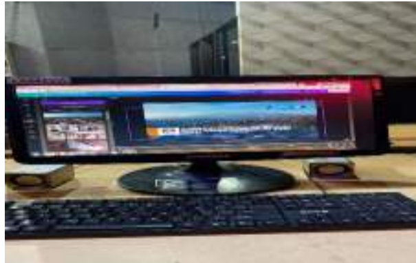
Gambar 9. Proses pengerjaan tumnail youtube JTV Madiun

Isi yang terdapat pada tumnail terdiri dari judul berita, logo jtv dan juga desain. Hingga pada proses pengupload-an nya di lengkapi dengan caption yang akan di share melalui youtube dan Instagram.