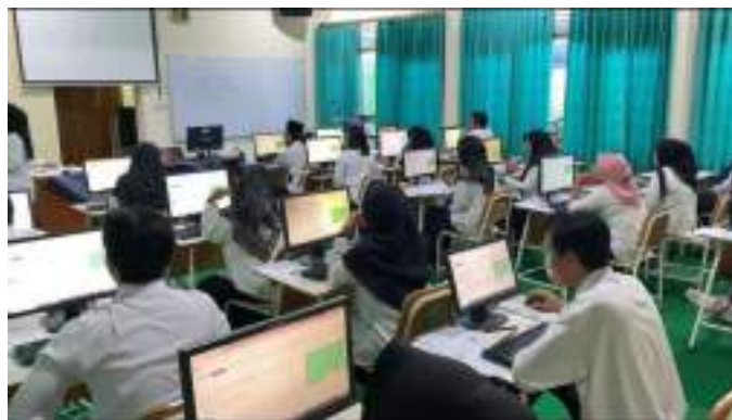
Gambar 21 : Liputan PPPK Kota Madiun

Liputan atau reportase dalam jurnalisme adalah kegiatan profesional yang dilakukan oleh wartawan atau jurnalis untuk mencari dan mengumpulkan informasi yang akan dijadikan berita. Liputan meliputi proses keseluruhan dalam pencarian berita, termasuk wawancara dengan sumber yang terkait dan pengumpulan data yang relevan 15