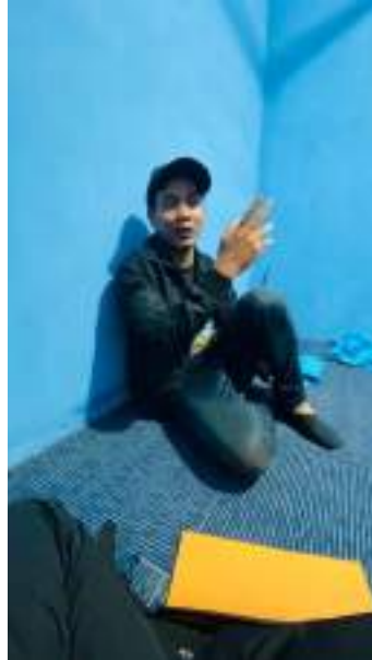
Gambar 5. Pengarahan dan pengenalan bagian-bagian JTV Madiun