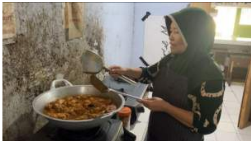
Gambar 16. Liputan kuliner Gontor 2