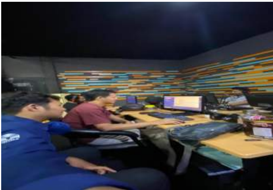
Gambar 11. Mahasiswa berlatih Bersama Mas Gara dalam pengeditan video berita

Editor merupakan orang yang bertugas untuk mengedit dan mengolah video mentahan yang dikirimkan oleh wartawan melalui email menjadi video berita yang layak untuk disiarkan kepada public. Terdapat beberapa penyaringan oleh pihak editor JTV terhadap berita yang sudah selesai di edit, yang nanti akhirnya akan disiarkan live pada sore harinya.