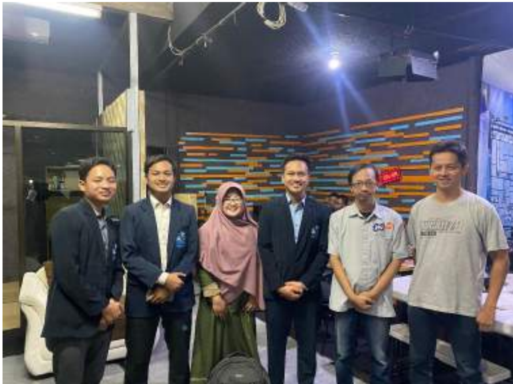
Lampiran 6. Pemberian Kenang-Kenangan Dan Penandatanganan Ia