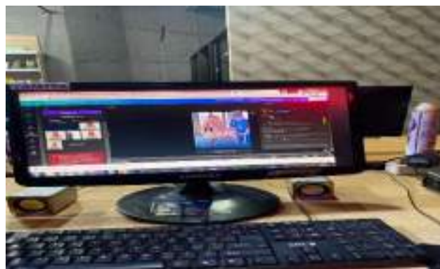
Gambar 10. Proses pengerjaan tumnail Instagram JTV Madiun