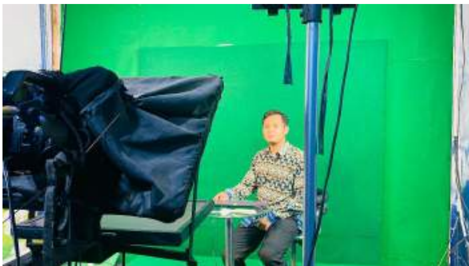
Gambar 6. Mahasiswa mencoba untuk menjadi presenter dan membawakan berita di JTV Madiun