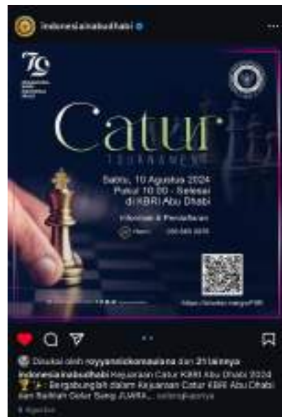
Gambar 4. Flyer Lomba Catur