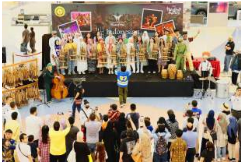
Gambar 24. Penampilan Muhibah Angklung Orchestra dan Dance di Mushrif Mall Hari ke - 1

turut membantu panitia membereskan acara, seperti mengembalikan meja dari gedung Mushfir Mall ke Gedung Kedutaan Besar Republik Indonesia, menyiapkan akomodasi untuk kembalinya Tim Muhibah Angklung ke penginapan, menghubungi jasa pengangkutan barang untuk membawa kembali peralatan Tim Muhibah Angklung.