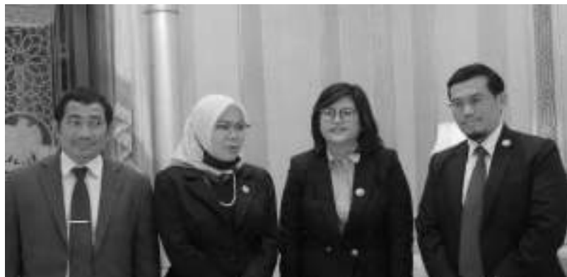
Gambar 35. Perpisahan dengan Home Staff