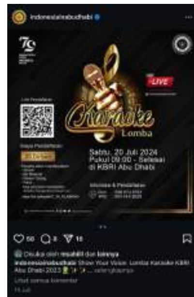
Gambar 7. Flyer Lomba Karaoke