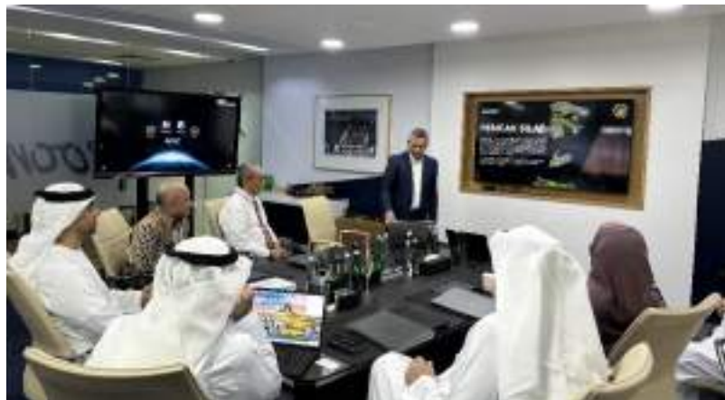
Gambar 36. Pertemuan CEO Zayed Sports Stadium dan Home Staff Guna Membahas