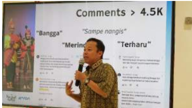
Gambar 30. Workshop Muhibah Angklung Orchestra dan Dance di Kantor KBRI Abu Dhabi