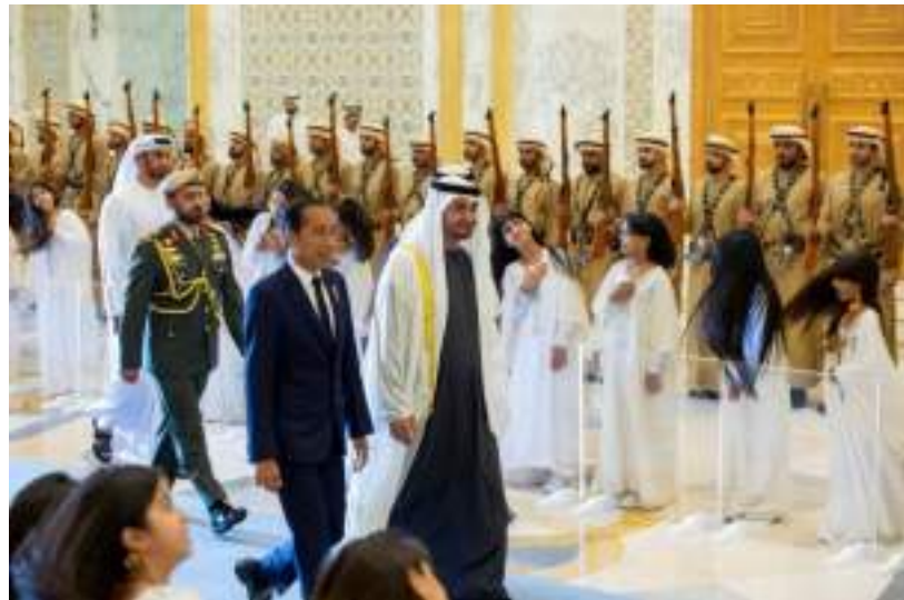
Gambar 32. Penyambutan Kunjungan Presiden Joko Widodo