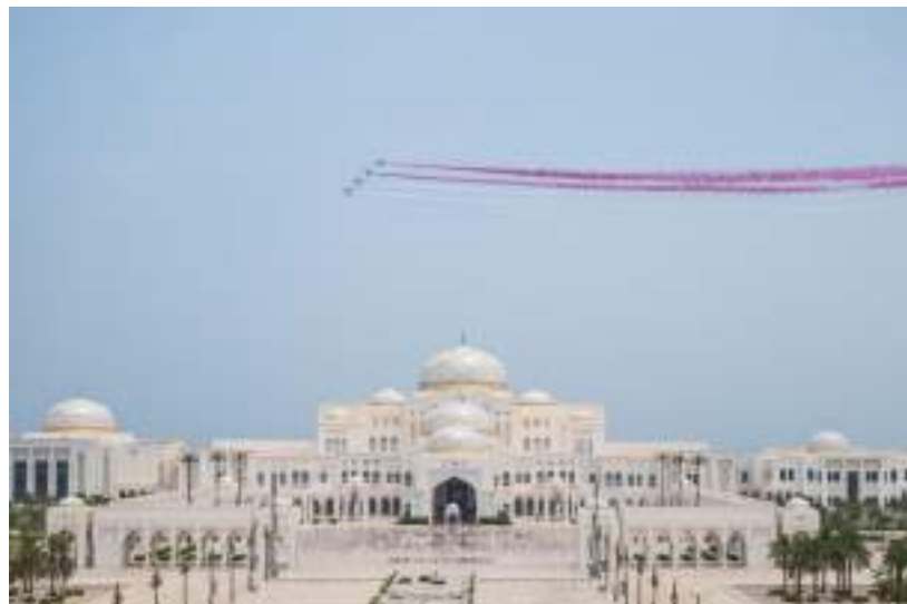
Gambar 38. Video Kunjungan Kenegaraan Presiden Joko Widodo dan Para Menteri