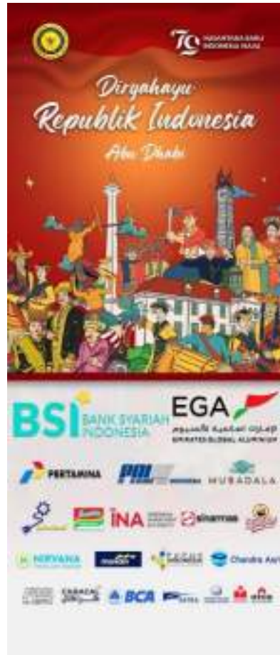
Gambar 16. Benner Sponsor HUT RI