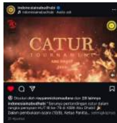
Gambar 6. Flyer Lomba Catur