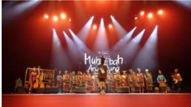
Gambar 21. Penampilan Muhibah Angklung Orchestra dan Dance di Cultural Foundation Theatre Abu Dhabi

dan juga survei pariwisata Indonesia. Mahasiswa magang juga membantu mengembalikan