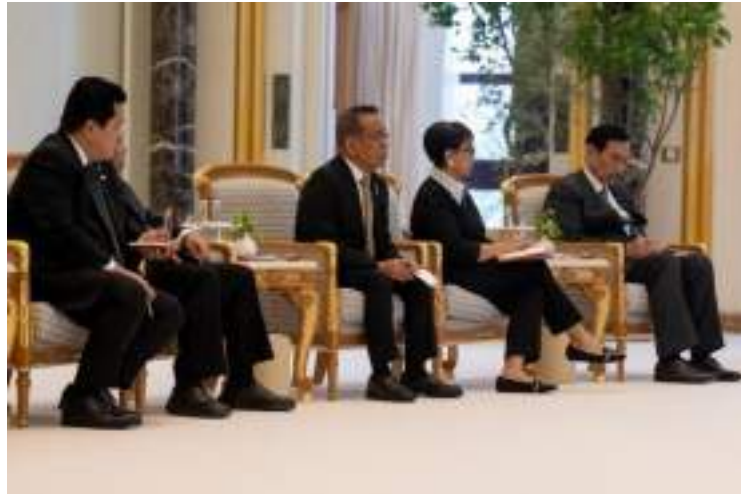
Gambar 19. Pertemuan Presiden dan Para Menteri untuk Membahas Perjanjian Bilateral