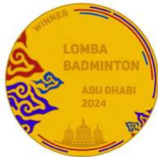
Gambar 13. Mockup Medali HUT RI bagian belakang

Pada mockup medali di atas, mahasiswa menggunakan beberapa unsur gambar yang merepresentasikan keindahan dan tradisi yang dimiliki oleh Indonesia antara lain: