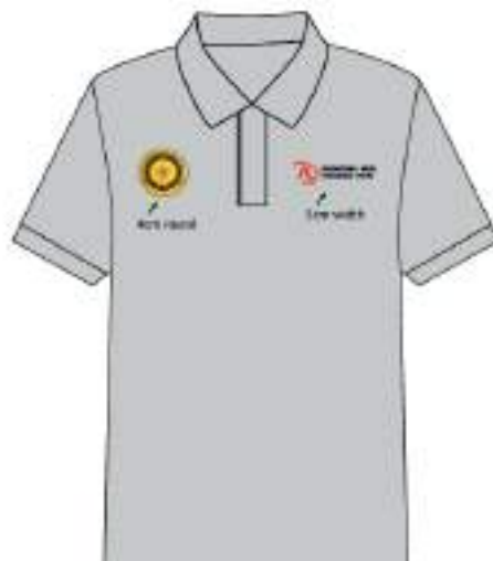
Gambar 10. Mockup Kaos HUT RI bagian depan

Adapun beberapa hasil desain mockup yang pernah dibuat oleh mahasiswa magang antara lain: