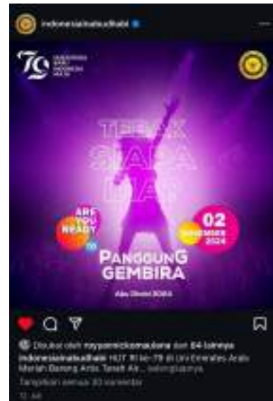
Gambar 3. Flyer Bintang Tamu