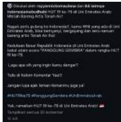
Gambar 41. Caption Bintang Tamu Panggung Gembira 2024