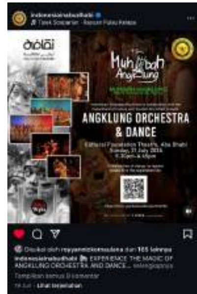
Gambar 5. Flyer Lomba Badminton