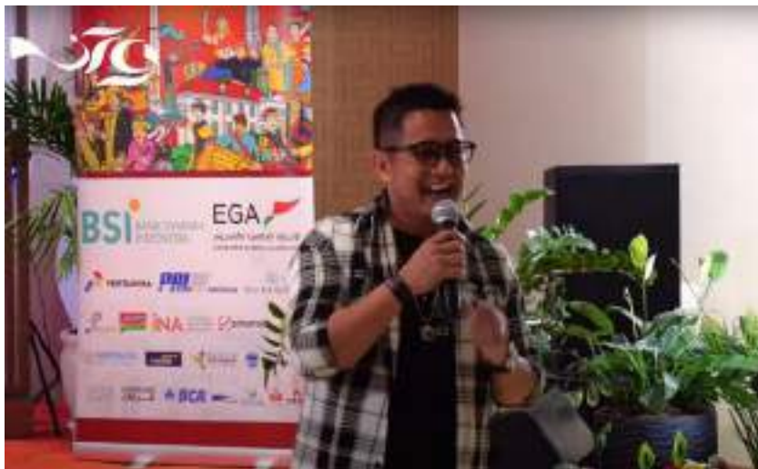
Gambar 14. Benner Sponsor HUT RI