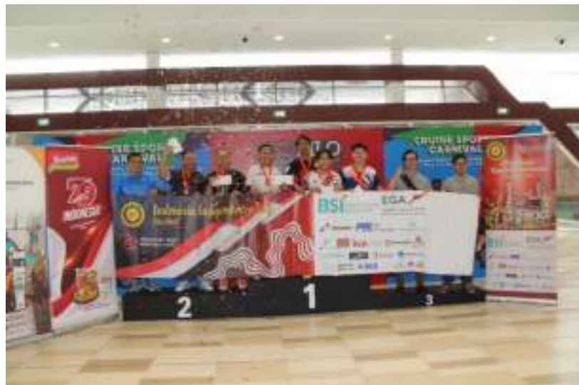
Gambar 33. Perlombaan HUT RI ke - 79 di Abu Dhabi