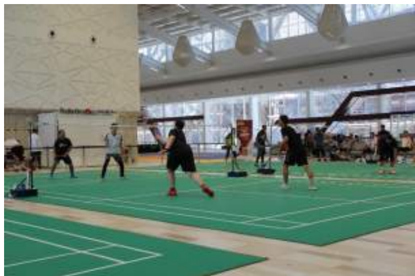
Gambar 39. Video Lomba Peringatan HUT RI ke 79