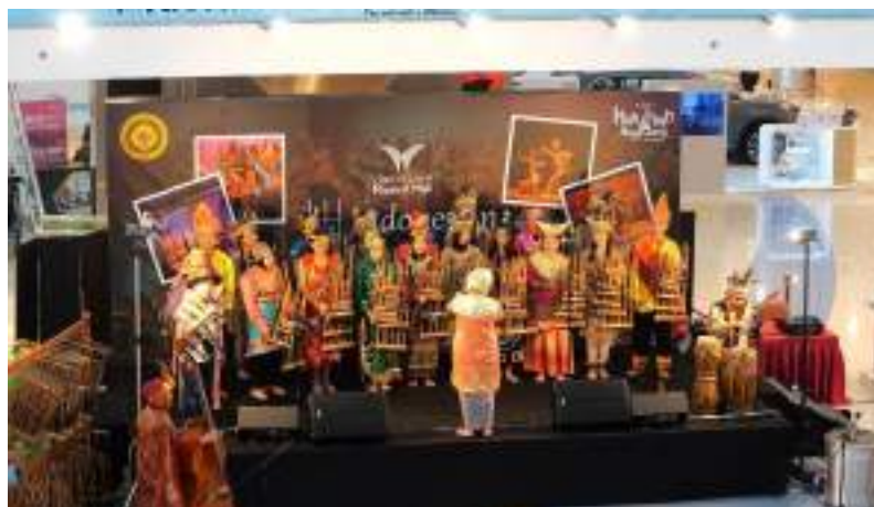
Gambar 27. Penampilan Muhibah Angklung Orchestra dan Dance di Mushrif Mall Hari ke - 2