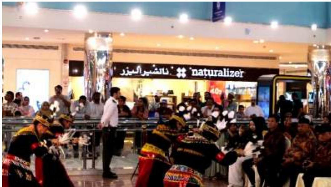
Gambar 26. Penampilan Muhibah Angklung Orchestra dan Dance di Mushrif Mall Hari ke - 1