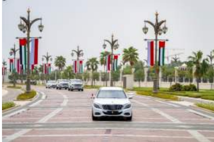
Gambar 20. Arak - Arakan Mobil Presiden