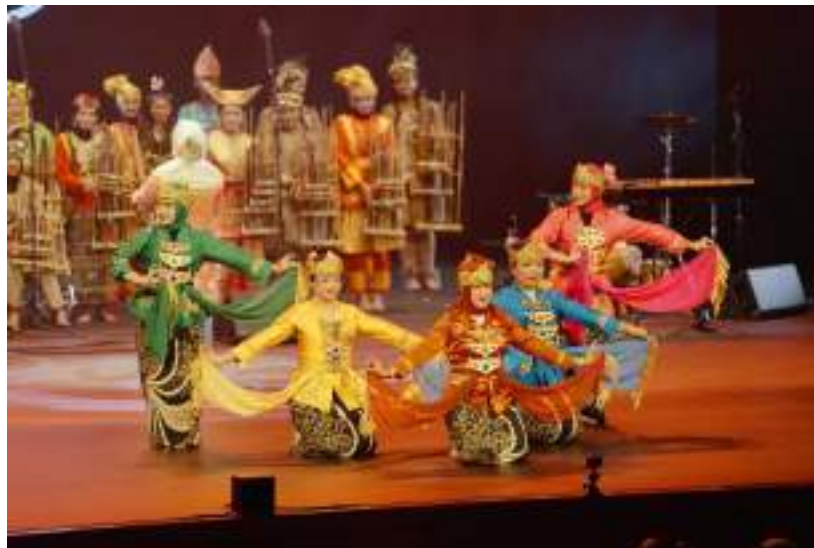
Gambar 22. Penampilan Muhibah Angklung Orchestra dan Dance di Cultural Foundation Theatre Abu Dhabi