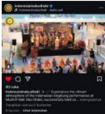
Gambar 9. Thumbnail Video Reals Anglung di Mushrif Mall