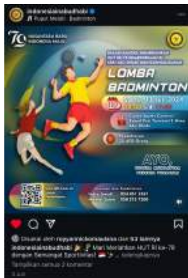
Gambar 2. Flyer Lomba Badminton

Adapun beberapa hasil flyer , poster dan video yang pernah dibuat oleh mahasiswa magang antara lain berupa poster Bintang Tamu event Panggung Gembira, Flyer Perlombaan Badminton, Video after movie Muhibah Angklung Orchestra and Tari , serta masih banyak lagi. Dari hasil karya tersebut, terdapat perbaikan yang bersifat minor sebelum hasil karya dimuat pada media digital milik KBRI. Perbaikan itu berupa penambahan keterangan tempat , tanggal dan penambahan durasi pada video. Namun secara keseluruhan, pihak KBRI menyukai hasil karya dari mahasiswa magang.