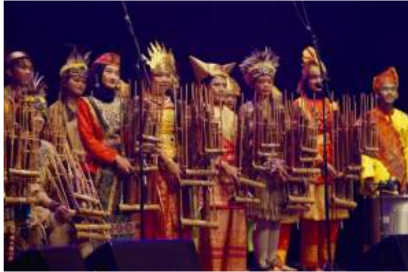
Gambar 23. Penampilan Muhibah Angklung Orchestra dan Dance di Cultural Foundation Theatre Abu Dhabi