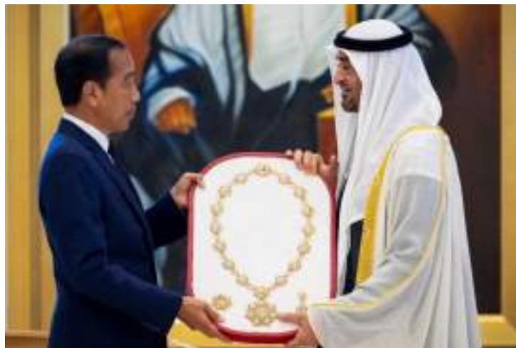
Gambar 17. Penyerahan Penghargaan Oleh Raja Mohamad Bin Zayed kepada Presiden Joko Widodo

Pada saat Kunjungan Presiden Joko Widodo dan Jajaran Menteri, mahasiswa magang turut membantu panitia mempersiapkan akomodasi bagi rombongan presiden, yakni menghubungi jasa sewa kendaraan yang ada di Abu Dhabi, menyiapkan penginapan bagi Presiden Joko Widodo dan Para Menteri di Emirates Pallace. Selain itu, Mahasiswa magang juga membantu tim dokumentasi mengabadikan momen penting dari kunjungan presiden tersebut.