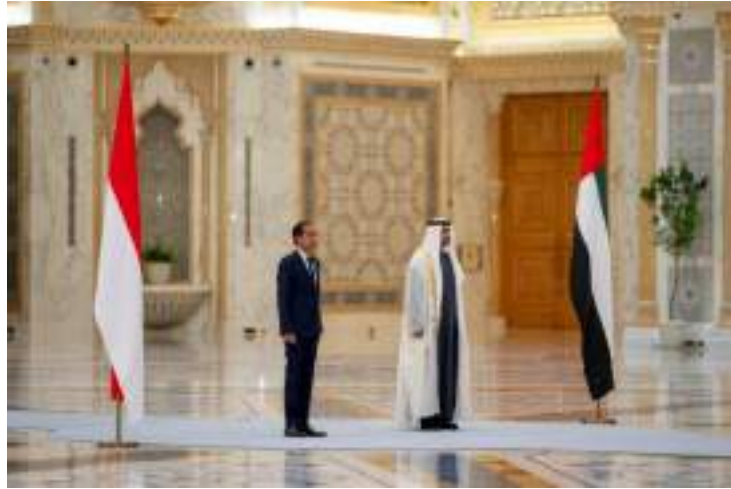
Gambar 18. Upacara Penyambutan Kunjungan Kenegaraan