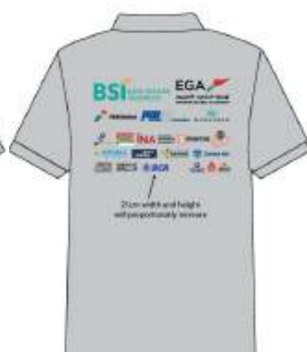
Gambar 11. Mockup Kaos HUT RI bagian belakang