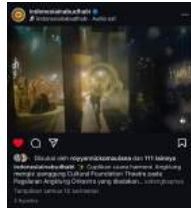
Gambar 8. Thumbnail Video Reals Angklung di Cultural Foundation