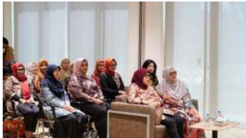
Gambar 31. Workshop Muhibah Angklung Orchestra dan Dance di Kantor KBRI Abu Dhabi