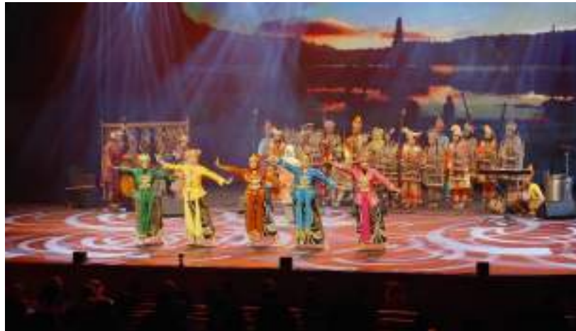
Gambar 34. Penampilan Muhibah Angklung Orchestra dan Dance di Cultural Foundation Theatre