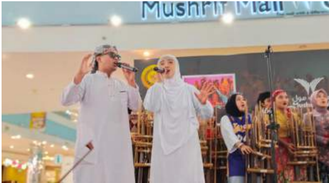
Gambar 25. Penampilan Muhibah Angklung Orchestra dan Dance di Mushrif Mall Hari ke - 1