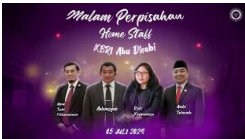
Gambar 15. Backgroun Perpisahan Home Staff