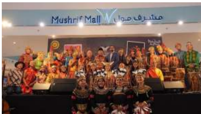
Gambar 28. Penampilan Muhibah Angklung Orchestra dan Dance di Mushrif Mall Hari ke - 2