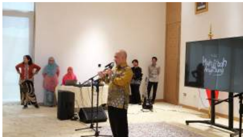
Gambar 29. Workshop Muhibah Angklung Orchestra dan Dance di Kantor KBRI Abu Dhabi

Pada saat acara penampilan, mahasiswa magang bertugas menjadi tim dokumentasi selama acara berlangsung yakni sebagai fotografer dan videografer, membagikan Angklung ke setiap peserta untuk di mainkan sesuai petunjuk pemateri. Pada saat pasca acara, mahasiswa magang bertugas menjaga pintu keluar dan meminta para peserta yang telah mengikuti workshop angklung untuk mengisi survei kepuasan dan survei terkait pariwisata Indonesia. Mahasiswa juga turut membantu panitia membereskan acara, seperti merapikan meja, kursi dan membersihkan sampah yang berserakan.