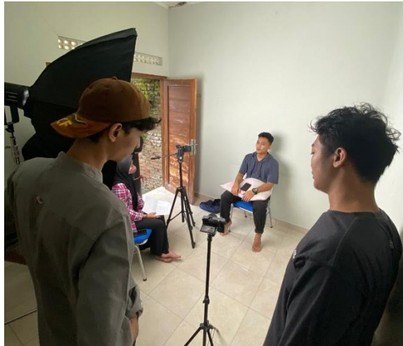
Gambar 3.1 bersama Kru Film Dokumenter di Pra Produksi

Masa Pra produksi merupakan tahapan kerja terpenting atau utama dalam setiap produksi film dokumenter. Dalam Pra Produksi film dokumenter “Metamorfosis” ini hal pertama yang di lakukan oleh Assisten kamera beserta kru adalah melakukan persiapan, pengembangan skenario, survei lokasi untuk syuting film (recce), blocking shot, mempelajari naskah yang sudah disetujui, menentukan kamera yang akan digunakan saat produksi, menguasai kamera agar kualitas gambar yang digunakan untuk produksi sesuai.