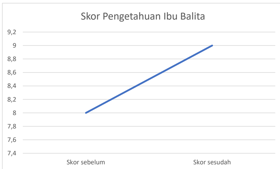
Tabel 1 Diagram Peningkatan Skor Pengetahuan

Pengetahuan ibu dan pola asuh orang tua merupakan hal yang dapat dimodifikasi melalui program pendidikan kesehatan dan sosialisasi informasi parenting. Program mencakup pemberian informasi dan praktik pemilihan makanan yang bergizi, cara pengolahan dan pemberian makanan yang baik, praktik kebersihan, serta pemanfaatan sarana kesehatan untuk memantau pertumbuhan dan perkembangan anak dapat diberikan untuk mencegah terjadinya stunting (Yanti, Betriana and Kartika, 2020).