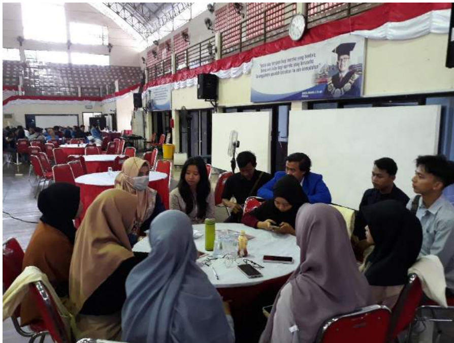
Gambar 1.3 Kegiatan Inkubasi Bisnis Hari Ketiga

BATIK ANYAR merupakan usaha di bidang kerajinan batik dan fashion dengan memunculkan motif yang kekinian akan tetapi tidak meninggalkan budaya batik yaitu penaklukan konstantinopel alasan kami adalah memperkanalkan motif yang tidak monoton seperti bunga, daun dll sehingga kaum remaja suka memakai batik dari kami sekaligus mensyiarkan tentang penaklukan konstantinopel lewat budaya batik.