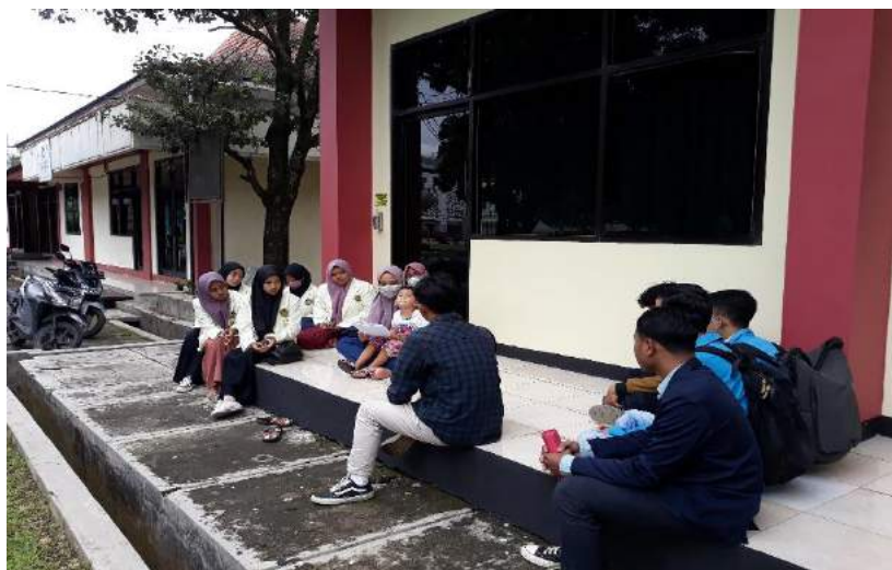
Gambar 1.2 Kegiatan Inkubasi Bisnis Hari Kedua

Solusi: Membuat motif dan cetakan sendiri dengan triplek dan kertas kotak makan