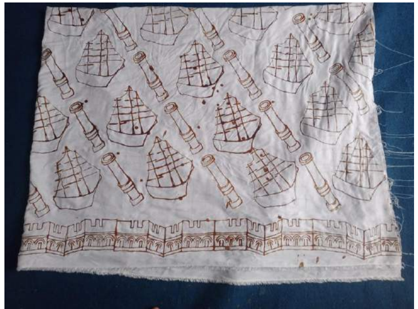
Gambar 1.7 Proses Batik Cap