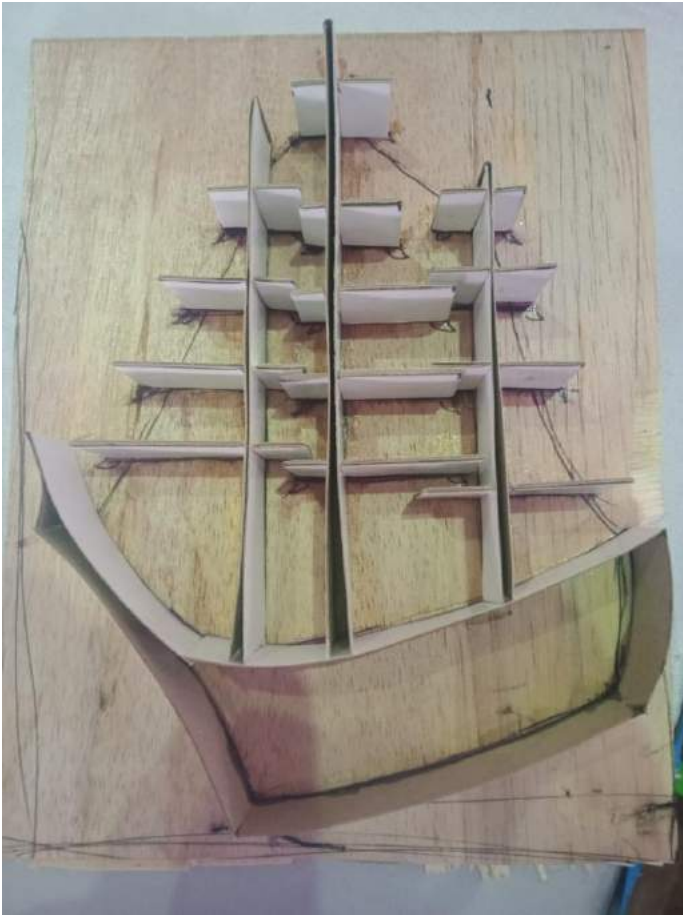
Gambar 1.8 Cetakan Cap “Kapal Al Fatih”