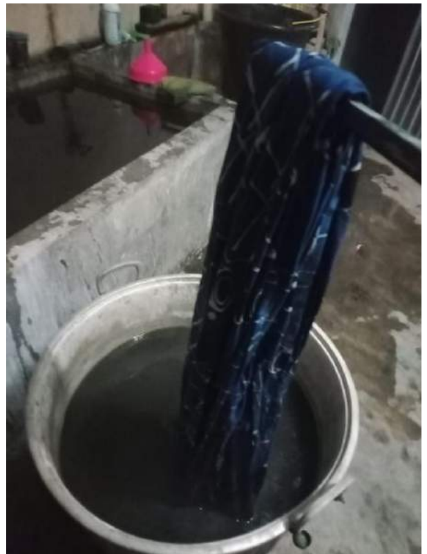
Gambar 1.9 Proses Lorot Kain