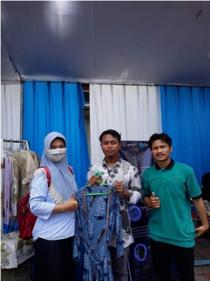
Gambar 1.10 Tim Batik Anyar Dan Dosen Pendamping