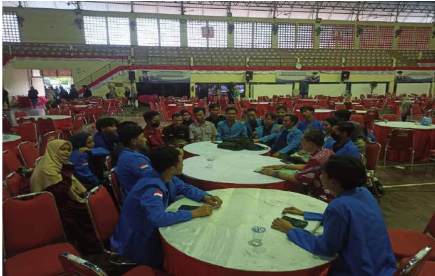
Gambar 1.4 Kegiatan Coaching Clinic Bersama Dengan Para Professional Coach