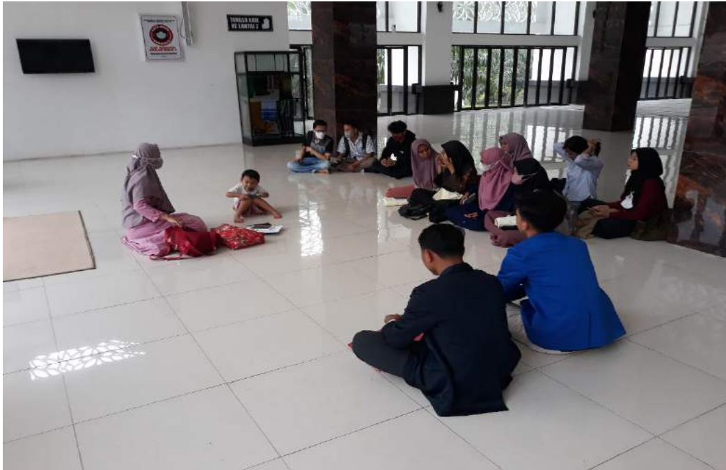
Gambar 1.1 Kegiatan Inkubasi Bisnis Hari Pertama

Kegiatan hari kedua inkubasi bisnis adalah mengetahui apa saja permasalahan yang ada dalam membangun startup BATIK ANYAR di dalam membangun startup tentunya kami mempunyai beberapa kendala yaitu