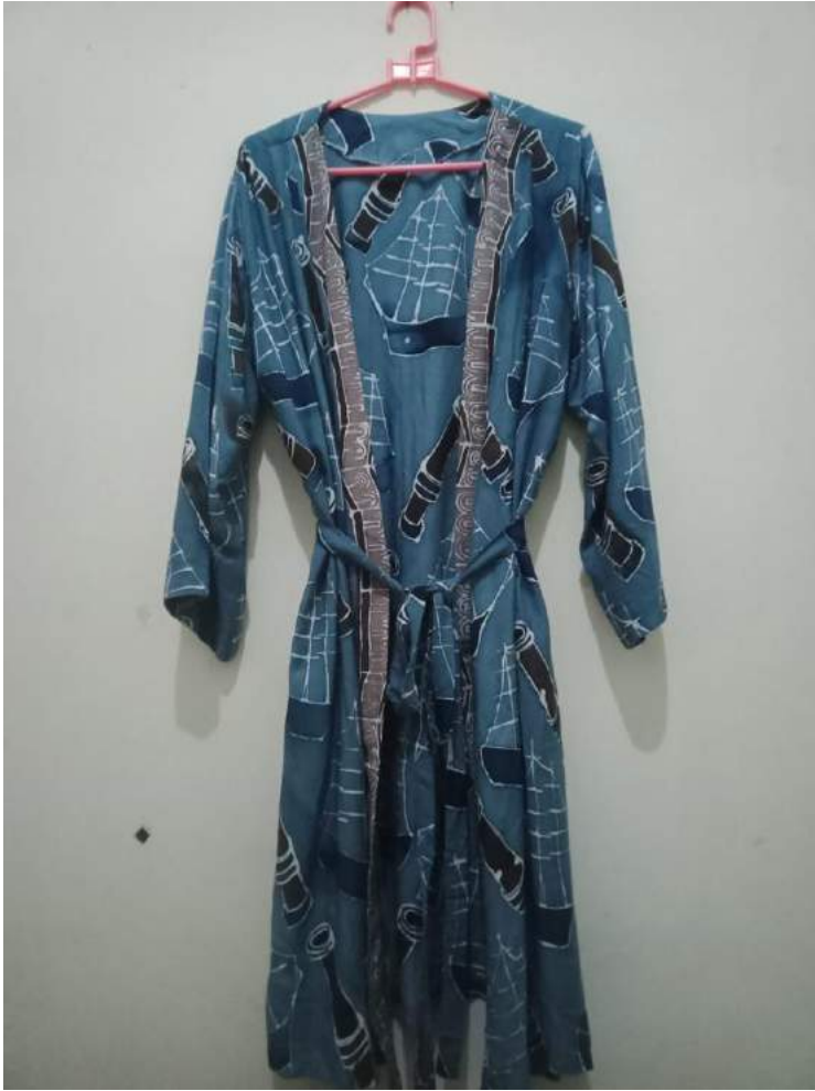
Gambar 1.6 Outer/Cardigan