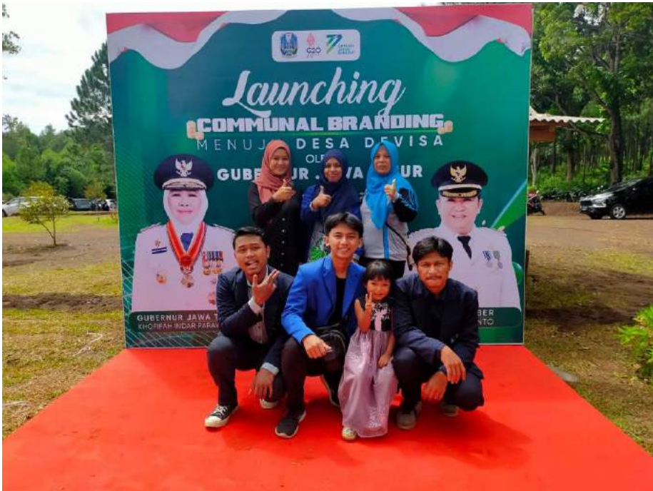
Gambar 1.11 Kelompok Magang Bersama Mitra Magang