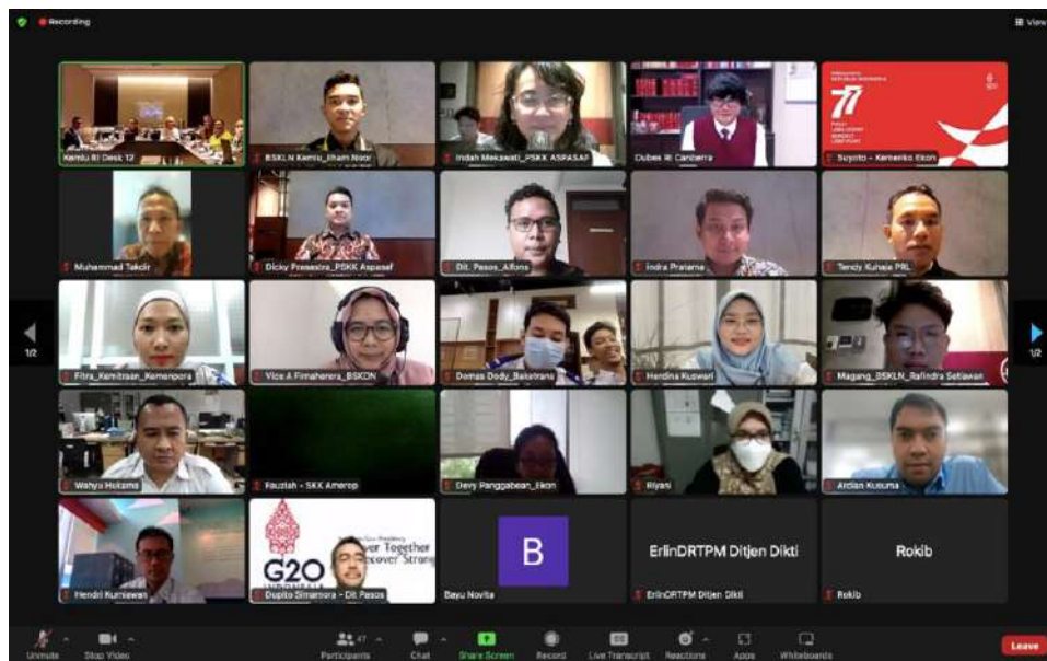
Photo 3: Training of Trainer at Hotel Episode Tangerang 5-6 October 2022