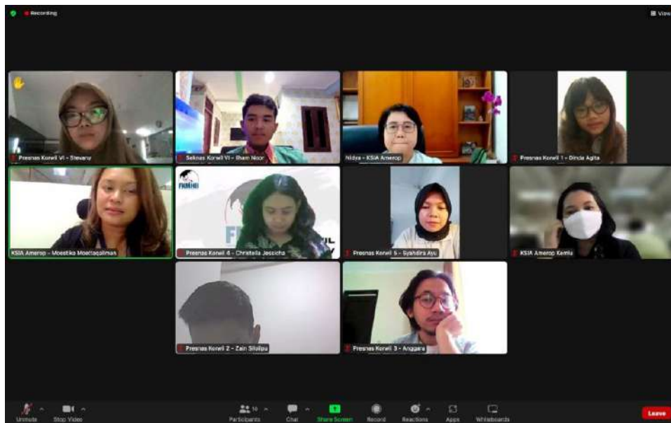
Photo 4: KSIA Amerop Kemlu RI & FKMHII Preparing for FEALAC Day 2022 5 September 2022