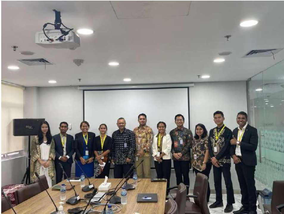
Photo 6: Meeting with Diplomat from Ministry of Foreign Affairs Timor Leste 23 September 2022