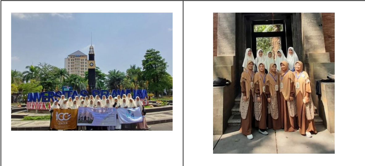
Foto 1. Perfotoan seluruh peserta putri MTQMN delegasi Universitas Darussalam Gontor Foto 2. Perfotoan Anggota Peserta MTQMN cabang MMN delegasi Universitas Darussalam Gontor