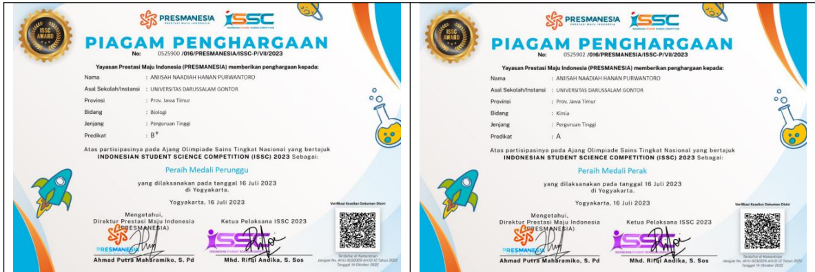
Foto 1. Piagam peraih medali perunggu-Biologi