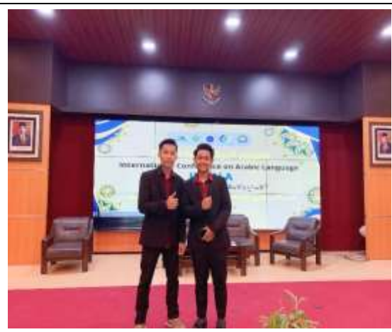
Foto 2. Presenter delegasi PBA UNIDA