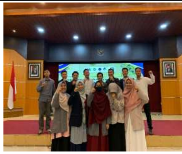
Foto 2. Foto Bersama ALUMNI UNIDA