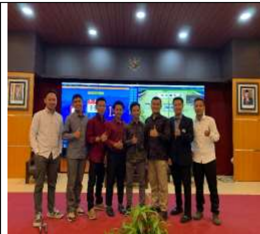
Foto 1. Foto Bersama dengan ALUMNI