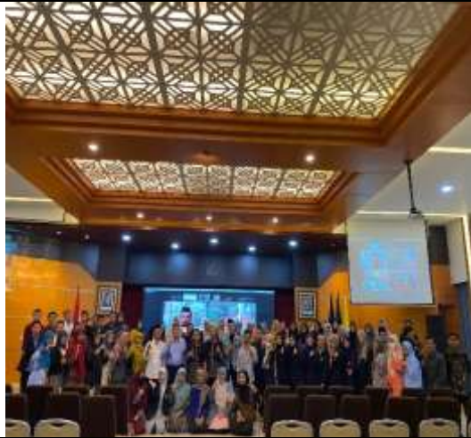
Foto 1. Foto Bersama Peserta Konferensi