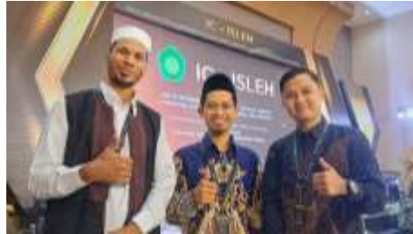
Foto 2. Bersama Dosen