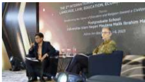
Foto 1. Penyampaian Materi