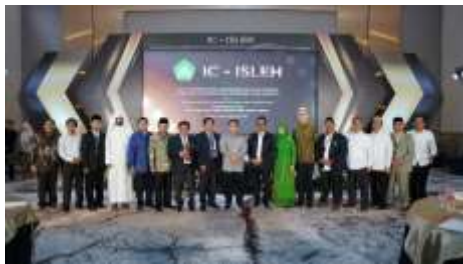
Foto 1. Grand Opening