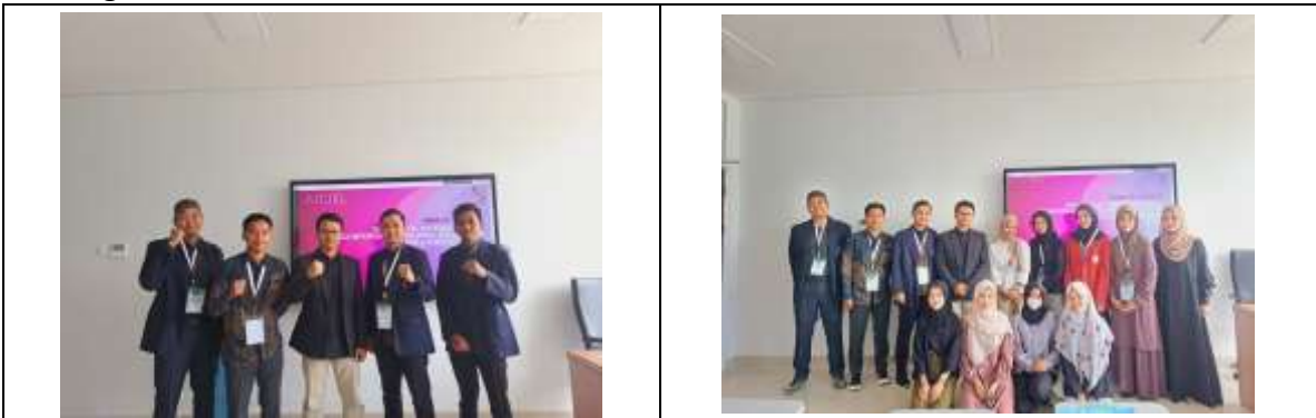
Foto 1. Penyampaian Materi