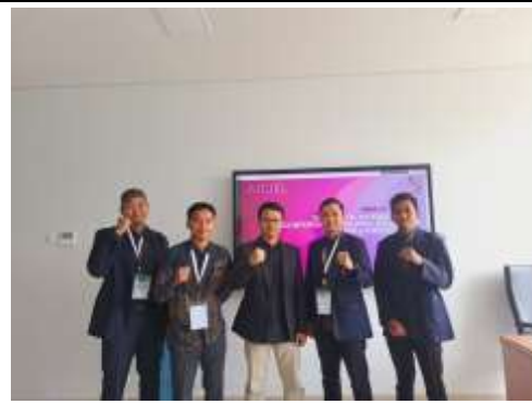
Foto 2. Bersama Dosen