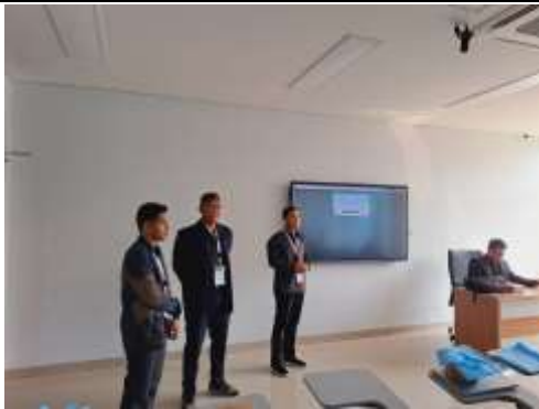
Foto 1. Presenter Makalah Ilmiah