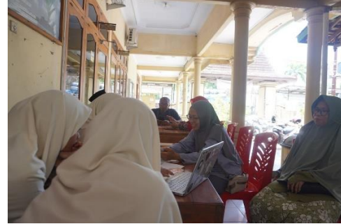
Foto 1. Pengarahan perencanaan kegiatan Foto 2. Pengajuan Desain dan hasil potret produk