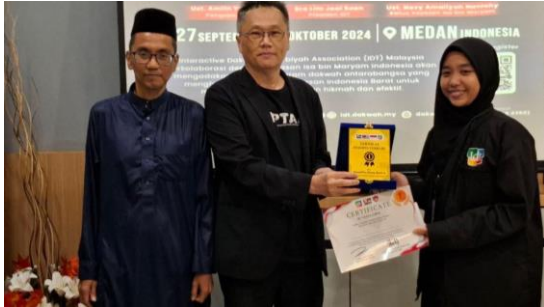
Foto 1. Penyerahan hadiah