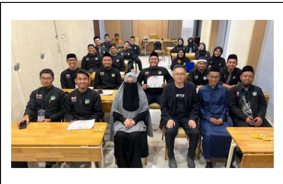
Foto 2. Penutupan dawah pro basics 2024