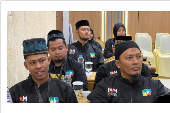
Foto 1. Materi dawah pro