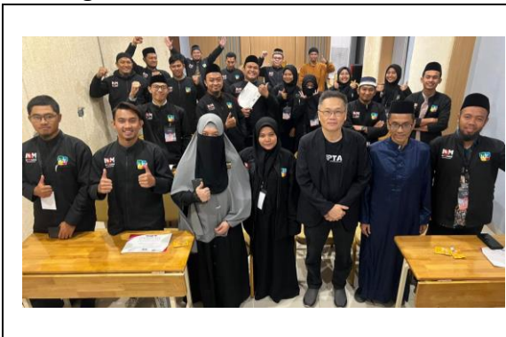
Foto 1. Penutupan kegiatan