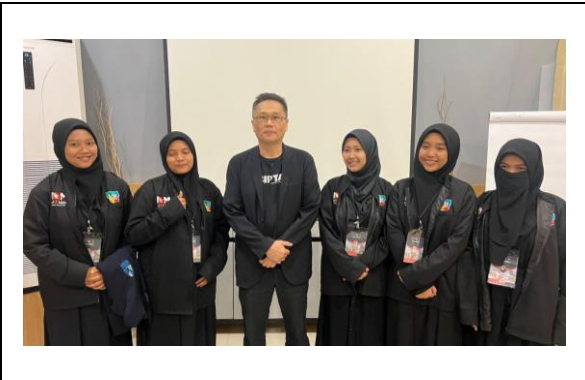
Foto 2. Perfotoan bersama pemateri