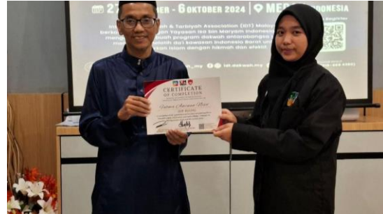
Foto 2. Penyerahan sertifikat