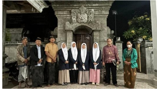
Foto 2. Foto Bersama PHDI Kabupaten Kediri setelah penyampaian hasil riset dan Policy Brief