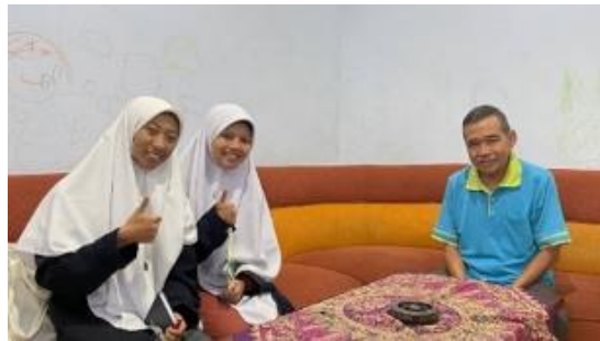
Foto 2 Wawancara dengan warga non-Hindu sekitar Pura Giri Natha Kediri