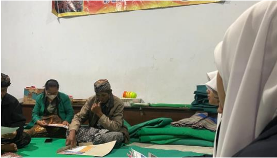
Foto 1. Penyampaian hasil riset dan Policy Brief kepada PHDI Kabupaten Kediri