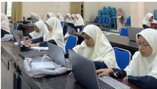
Foto 1. Persiapan PKP2