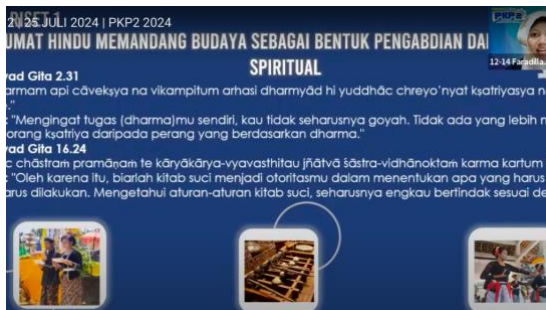
Foto 2. Pelaksanaan PKP2