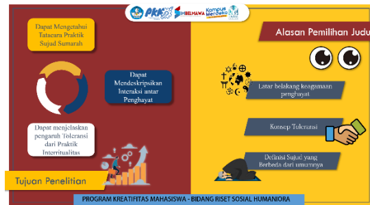
Foto 2. Pelaksanaann PKP2