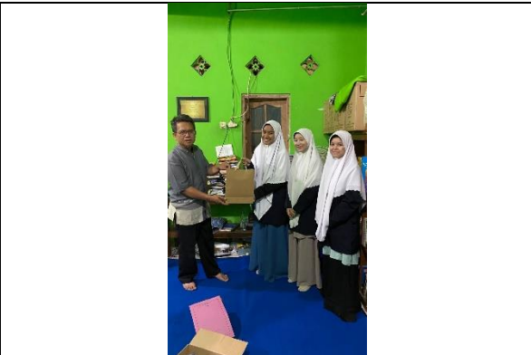
Foto 2. Foto Bersama