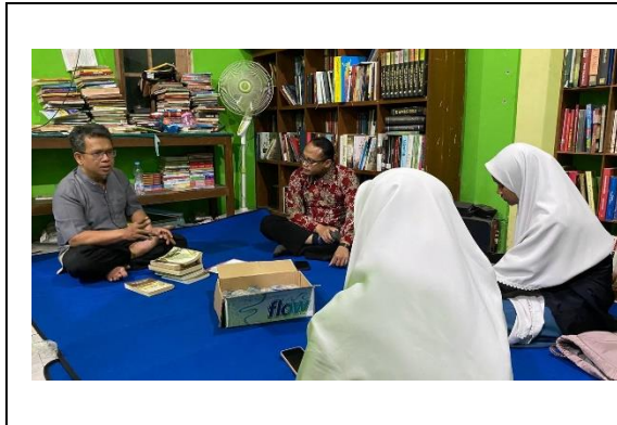
Foto 1. Penyampaian Hasil Riset