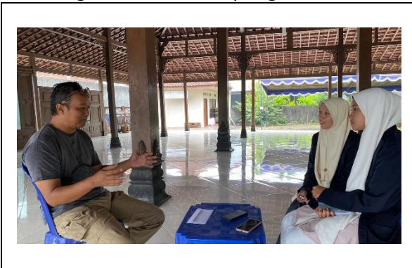
Foto 1. Wawancara pertama dengan sekretaris Pendopo