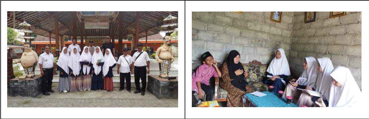
Foto 1. Bersama Kepala Desa