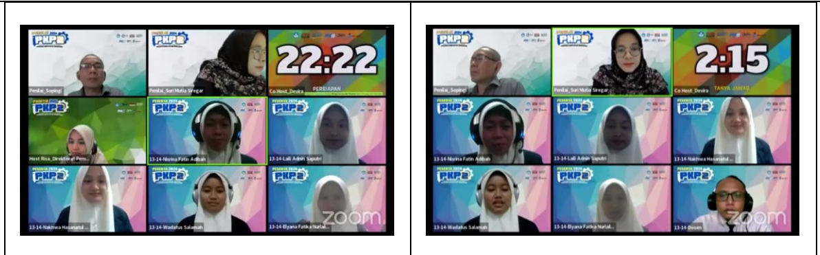
Foto 1. Sesi Persiapan