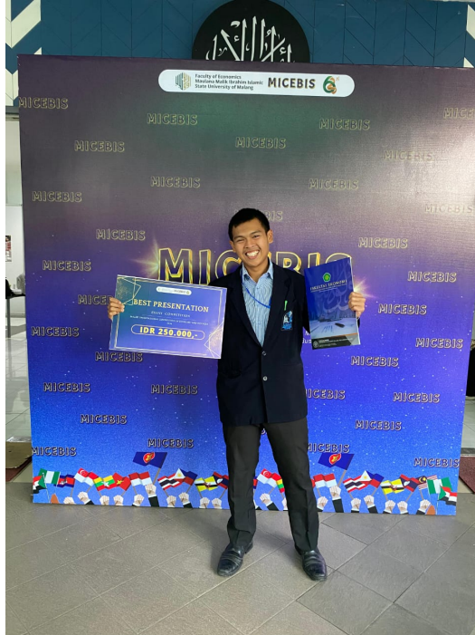
Foto 1. Juara Lomba Essay

No Dok : 1924 /UNIDA/FEM-y/VI/1446 Tgl Berlaku : 16-07-1443/17-02-2022 No Revisi : Tgl Revisi : - Lembar : 3 / 4