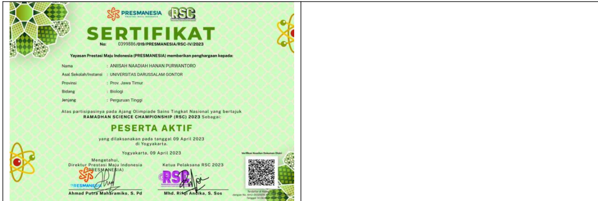
Foto 1. Sertifikat Peserta aktif