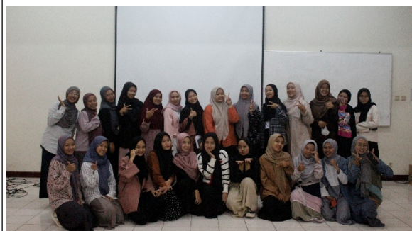
Foto 2. Suasana foto bersama UAD