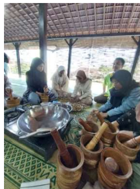
Foto 2. Suasana saat membuat Jamu