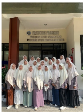
Foto 1. Suasana di kampus UAD