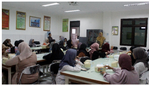
Foto 1. Suasana saat praktek Lab