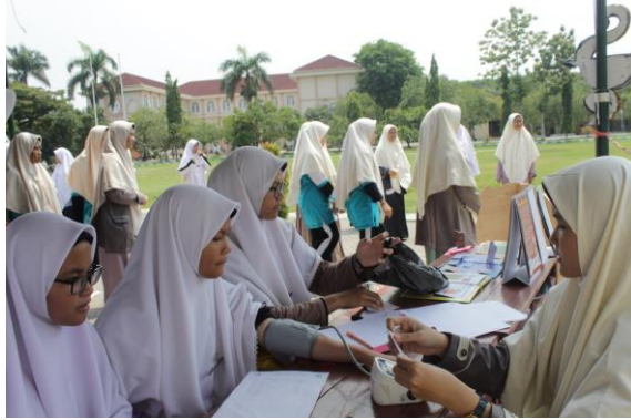
Foto 1. Pengenalan Tekanan darah Normal