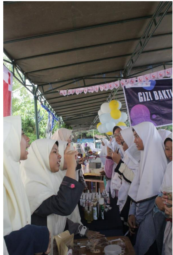
Foto 2. Penjelasan Mengenai Produk Fakultas