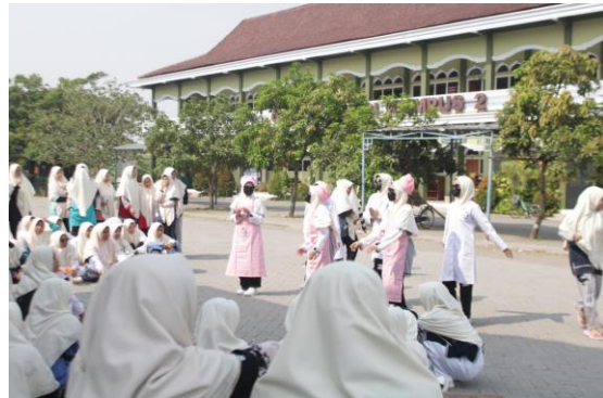
Foto 2. Perlombaan HKN ke-59