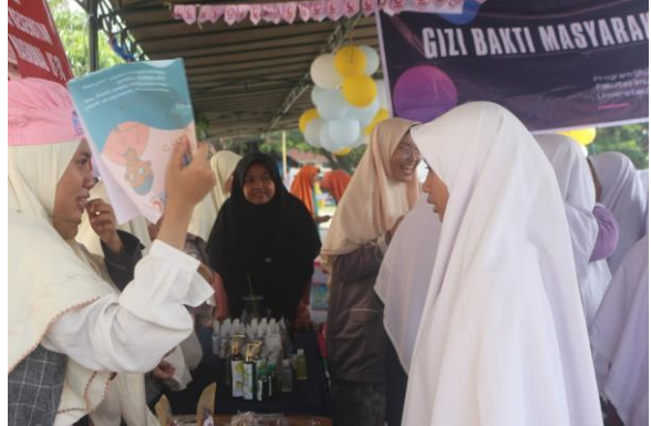
Foto 2. Penjelasan Gizi Seimbang