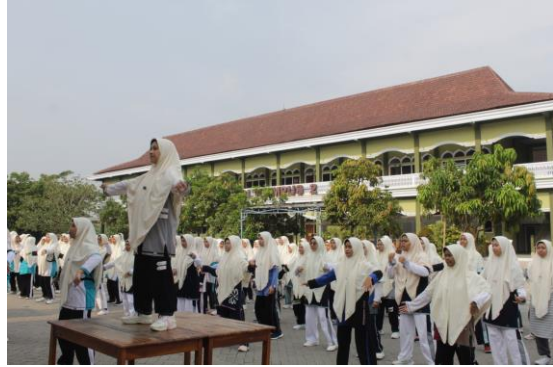
Foto 1. Olahraga Bersama