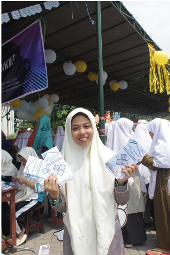
Foto 1. Pembagian Brosur