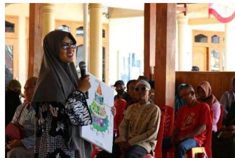
Foto 2. Sosialisasi Gizi Seimbang