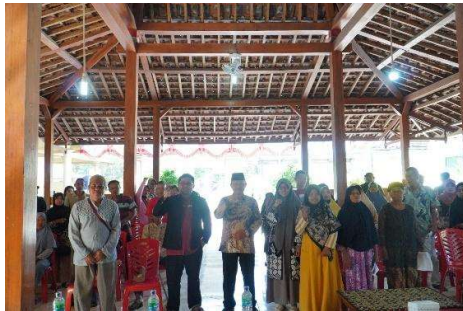
Foto 1. Foto Bersama Peserta GEBARAN

A. Kegiatan I Foto Bersama peserta GEBARAN