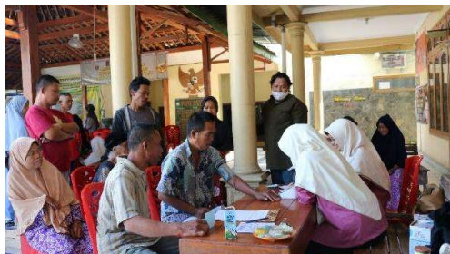
Foto 1. Medikal Check UP