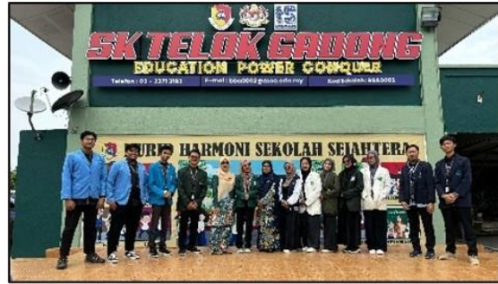
Foto 1. Bincang Budaya Internasional (Seminar Antarbangsa Budaya Malaysia dan Indonesia) Foto 2. Sukarelawan mosma students Kolaborasi dengan Malaysian Student di Sekolah Rendah Telok Gadong Klang 15 hari