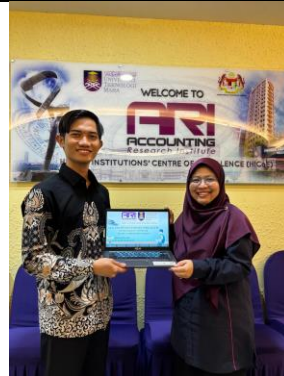
Foto 3. Presentasi Seminar Internasional