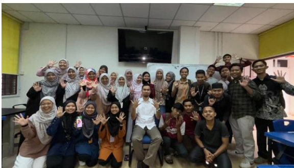
Foto 2. Module Pembelajaran MOSMA Student Research Institute