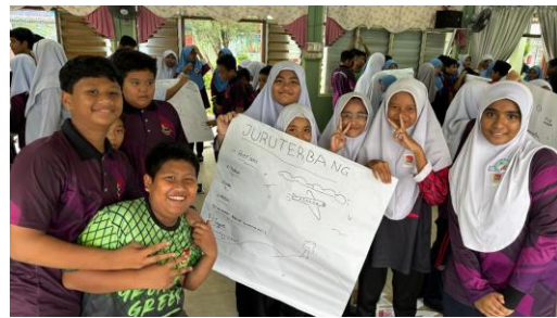
Foto 4. Mengajar di SK Telog Gadong Malaysia