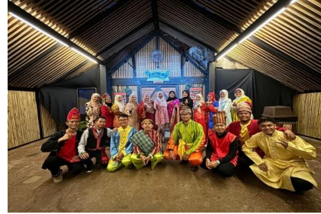
Foto 1. The Islamic Perspective Of Environmental And Social Governance" Bersama Pelajar International Enrichment Programme- Mora Overseas Student Mobility Award (Mosma) Foto 2. Penghargaan Kelulusan Sebagai Mahasiswa Universitas Teknologi Mara (UiTM) Malaysia