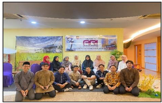
Foto 1. Kedatangan MOSMA Student ke Malaysia